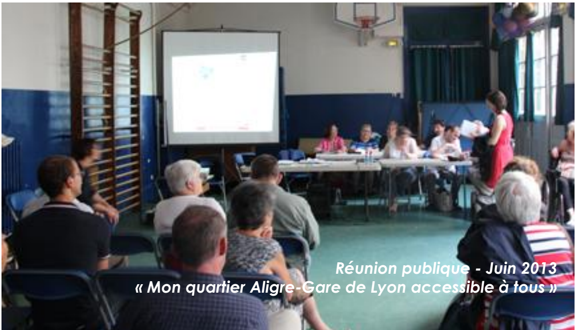
Réunion publique - Juin 2013 « Mon quartier Aligre-Gare de Lyon accessible à tous »

Article 3. Le périmètre de chaque Conseil de quartier est indiqué en annexe de la Charte.