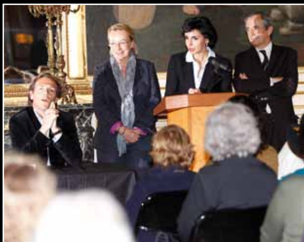
Le 11 mai, un comité d'initiative et de consultation d'arrondissement a fait un état des lieux avec les habitants dans le domaine de la propreté. 7