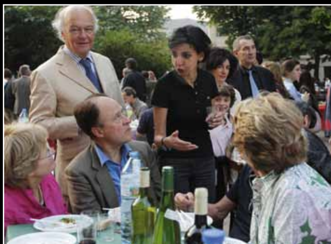
Le 4 juin, Rachida Dati au dîner annuel de la paroisse Sainte-Clotilde. 7