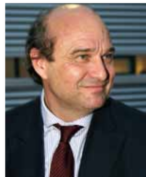
Yves Pozzo di Borgo, sénateur, conseiller de Paris