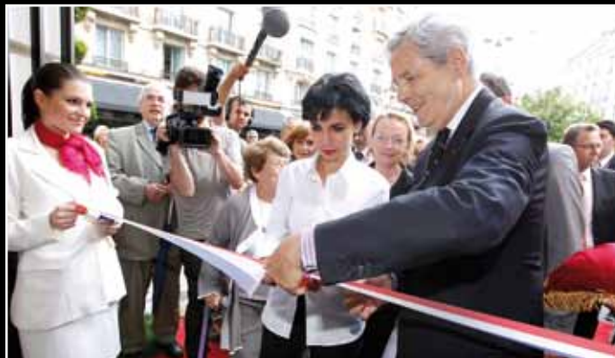
Le 26 mai, inauguration du Monoprix de la rue du Bac par Rachida Dati. 7