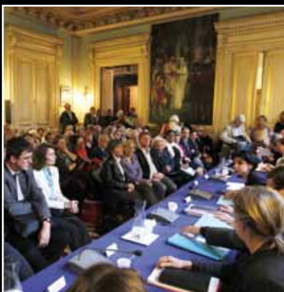
Le 31 mai, réunion publique sur l'aménagement des voies sur berges. 7