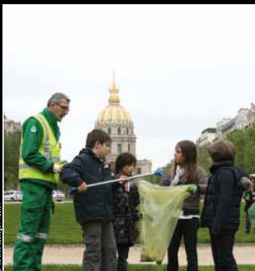
Les 17 et 28 mai, « Opérations éco-jeunes » avenue de Breteuil : ramassage des déchets jonchant les espaces verts, action de prévention et distribution de cendriers portatifs à la sortie du lycée Duruy. 7