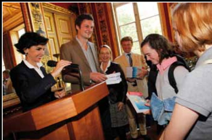
Le 3 juin, remise de livres aux élèves méritants des collèges et lycées de l'arrondissement. 7