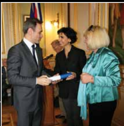
Le 4 juin, remise des médailles nationales de l'ordre du mérite. 7