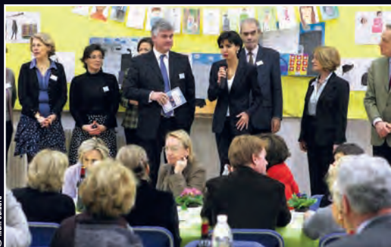
Le 4 février, déjeuner de l'association Inter 7.