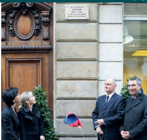
7 ARRIVÉ : INAUGURATION DE LA PLAQUE CÉSAR (P.14)