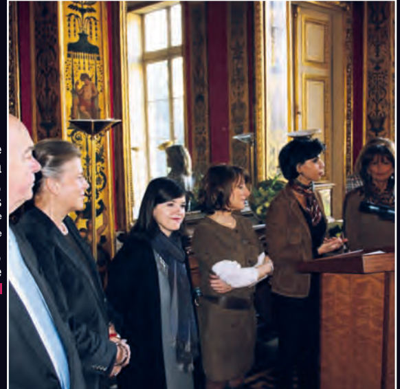
Le 24 février, réunion du Rotary Paris Quai d'Orsay.