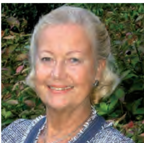
Martine Aurillac, Député de Paris, Vice-présidente de la commission des affaires étrangères