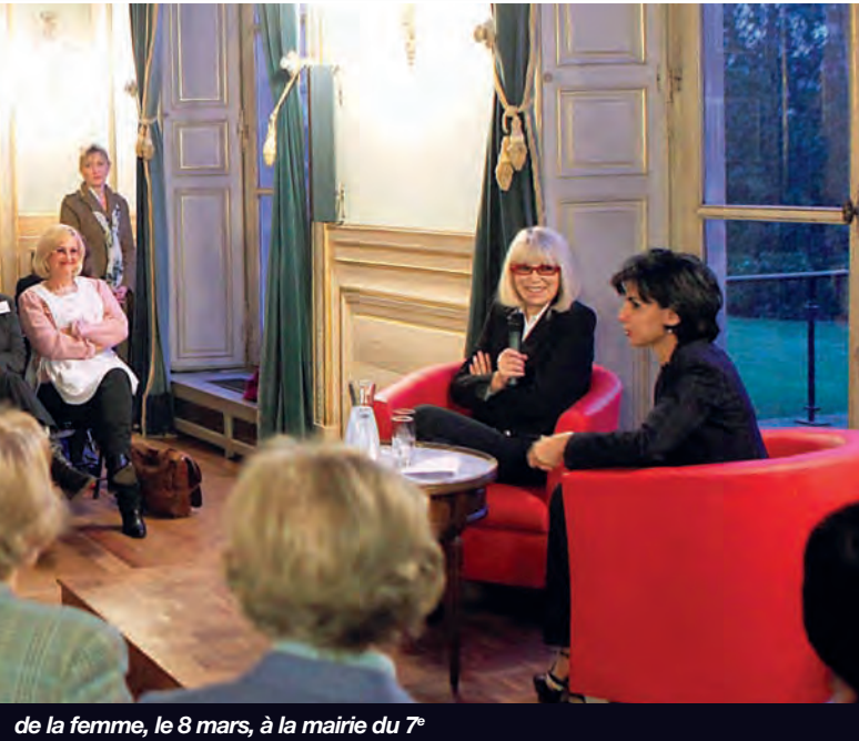
de la femme, le 8 mars, à la mairie du 7 e