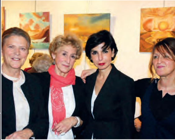
Le 18 février, vernissage de l'exposition des adhérents du club Malar.