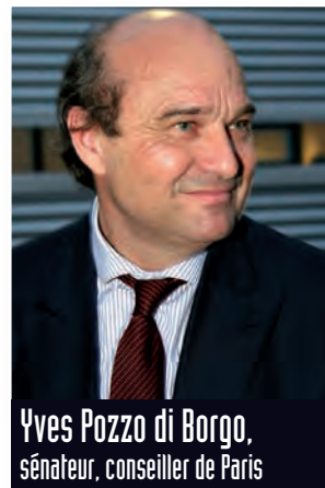
Yves Pozzo di Borgo, sénateur, conseiller de Paris