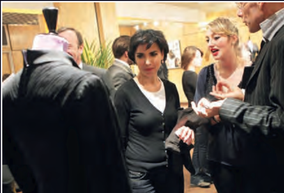
Le 28 février, présentation de la 1 ère collection de prêt à porter du lycée professionnel Albert de Mun.