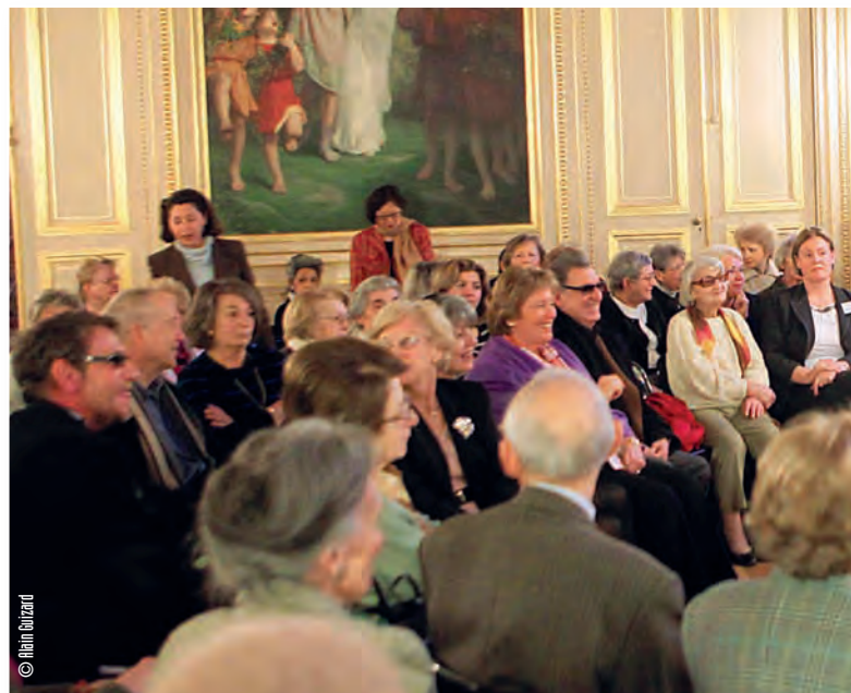
Conférence-débat autour de Mireille Darc à l'occasion de la Journée internationale

20 rue Surcouf, 7 e www.laviedeplusbelle.org - contact@laviedeplusbelle.org