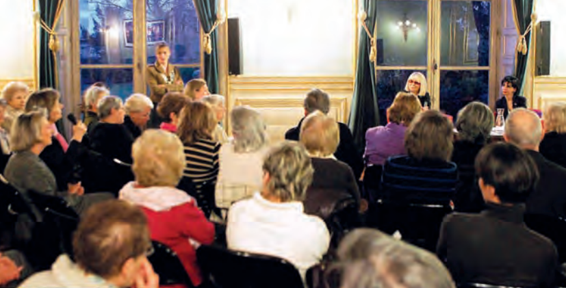
DOSSIER : LA SANTÉ DES FEMMES (P.8)