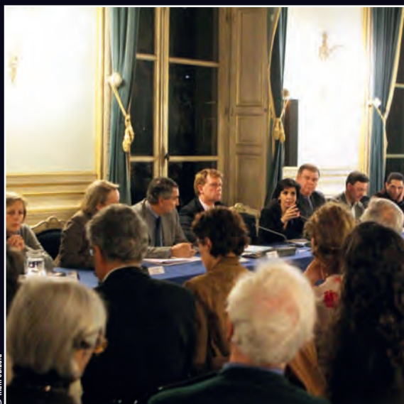
Le 7 février, réunion d'information sur les aménagements de la rue de Verneuil.