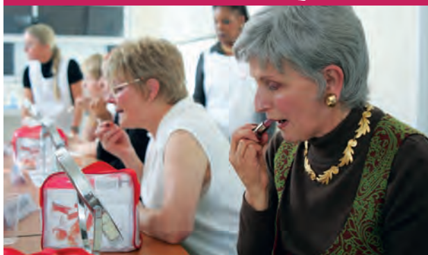
7 ASSOCIATIF : LA VIE, DE PLUS BELLE... (P.17)