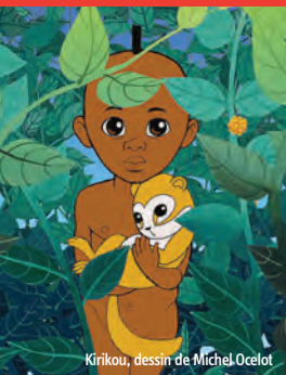
Kirikou, dessin de Michel Ocelot

Demandez vite votre Pass en Mairie du 11 e ! Rendez-vous au kiosque culture à la Mairie du 11 e ou sur mairie11.paris.fr