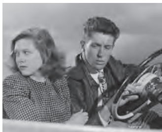
Les Amants de la nuit, Nicholas Ray 1948