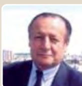
Tony Dreyfus Député de la 5 e circonscription { 10 e arrondissement } Ancien ministre