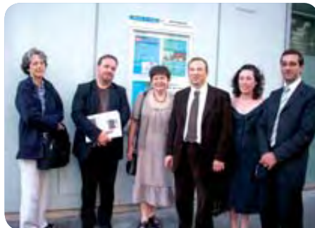
• Inauguration du panneau de la rue de l'Aqueduc

Durant les mois de juillet et août, 11 autres panneaux ont été installés sur l'ensemble des Conseils de quartier du 10 e . 12 autres panneaux complèteront le dispositif d'affichage d'ici quelques mois.