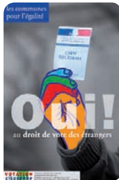
* La campagne de votation citoyenne (pour le droit de vote aux élections locales des étrangers non ressortissants de l'Union européenne et résidant en France), que nous annonçons dans le précédent numéro, a été reportée au printemps 2011.

AFRANE , 16 passage de la Main d'Or, 75011 Paris/ Tél : 01.43.55.63.50 - Fax/01.43.57.07.44 Email : afrane.paris@gmail.com www.afrane.asso.fr