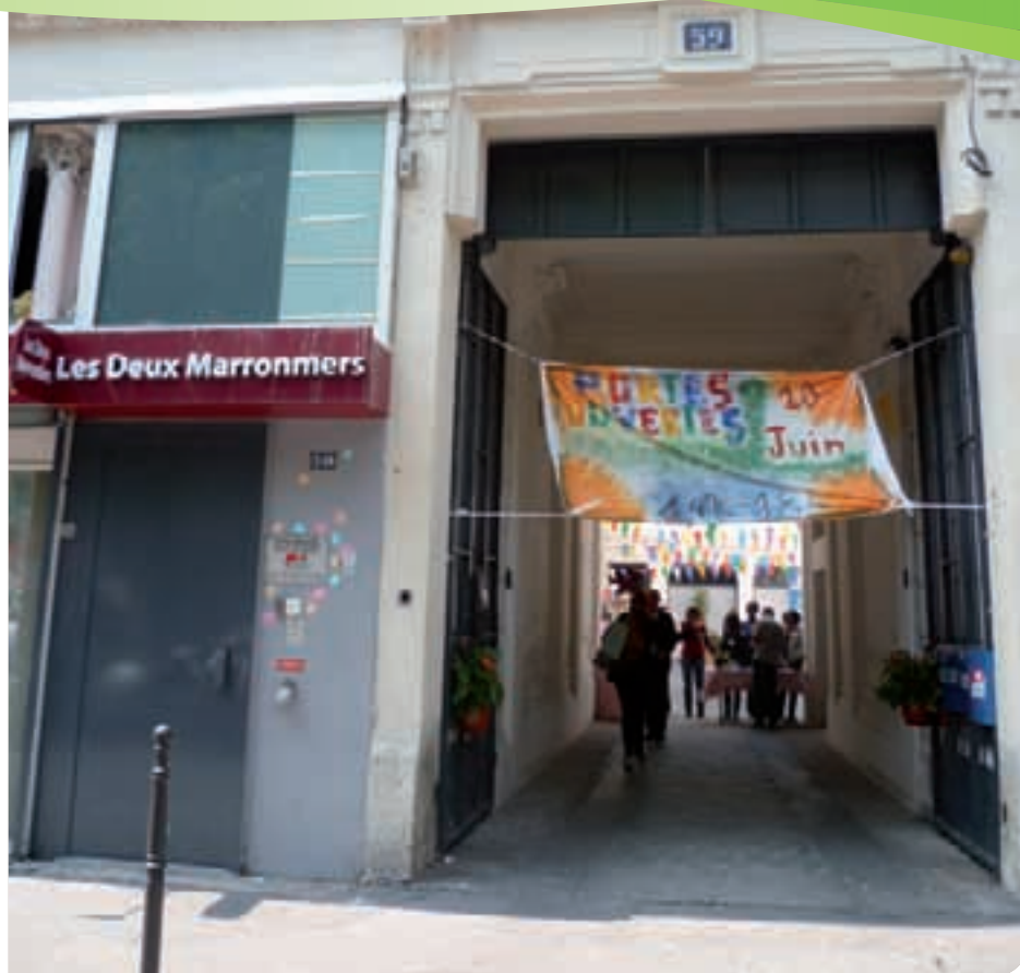
* Maison d'accueil Les 2 Marronniers, située boulevard de Strasbourg