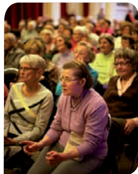
• Les seniors sont venus en nombre célébrer le 2 e anniversaire de leur conseil

Là aussi, nous avons un rôle à jouer dans la discussion pour l'élaboration de propositions de justice sociale tenant compte des besoins du plus grand nombre. »