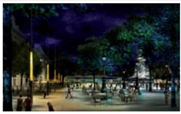
© TVK Architectes Urbanistes / myluckypixel – G. Morin, O. Plou / AIK – Yann Kersalé