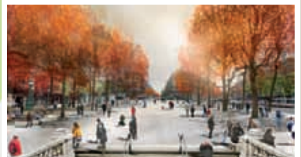
© TVK Architectes Urbanistes / myluckypixel – G. Morin, O. Plou