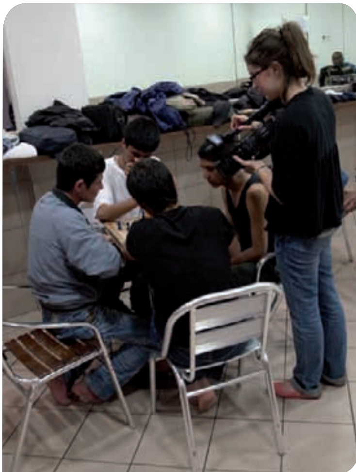
• Scène de tournage du documentaire réalisé par le Conseil de la jeunesse

Cette épreuve a ouvert nos yeux sur la dure réalité de l'exil et la vie d'enfants qui parcourent le monde dans l'espoir de trouver une vie meilleure en Europe.