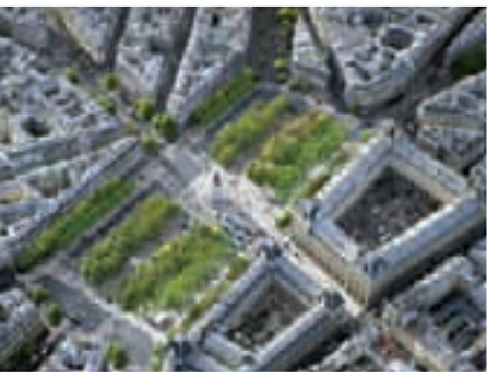
© TVK Architectes Urbanistes / myluckypixel – G. Morin, O. Plou / Photo Air Images – Ph. Guignard