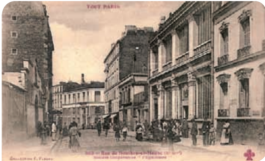
* Les locaux de la coopérative l'Égalitaire, qui étaient situés rue de Sambre-et-Meuse

Avec la Bellevilloise et la Moissonneuse, elle est à l'avant-garde des coopératives parisiennes. Le produit de l'épargne des sociétaires permet d'investir dans la pierre et la coopérative va construire un nouveau bâtiment au numéro 17 de la rue devenue Sambre-et-Meuse depuis 1877. Le 6 février 1894, l'architecte Raphaël