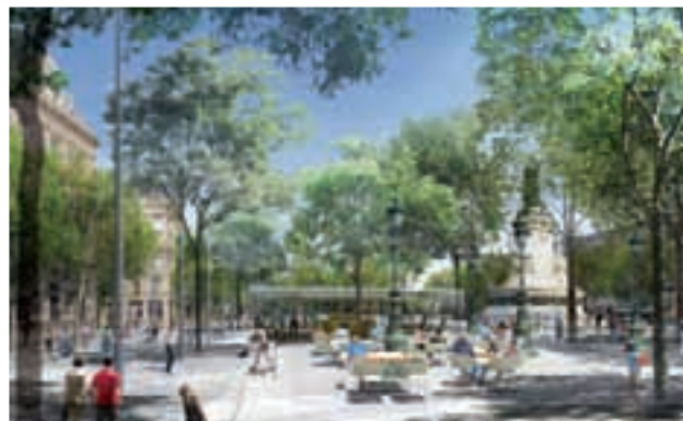
© TVK Architectes Urbanistes / myluckypixel – G. Morin, O. Plou / Photo Air Images – Ph. Guignard

Rémi Féraud et les élus du 10 e vous souhaitent une bonne et heureuse année