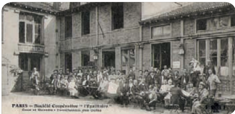
* La cour et la buvette de l'Égalitaire

L'histoire des lieux garde la mémoire de débats houleux sur les choix liés à la survie de la coopérative, l'élargissement de ses missions, la solidarité avec des sociétés sœurs, et aussi des vifs affrontements entre partisans de la réforme et de la révolution. Entre le pire et le meilleur, pendant trente-huit ans, des hommes et des femmes vont tenter d'expérimenter de nouvelles formes du « vivre ensemble ».