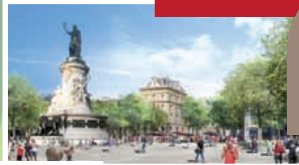
© TVK Architectes Urbanistes / myluckypixel – G. Morin, O. Plou / Photo Air Images – Ph. Guignard