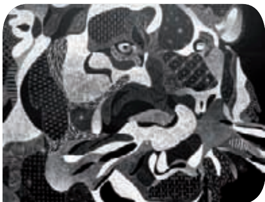
* Détail de l'œuvre de Philippe Baudelocque affichée dans la cour de l'école