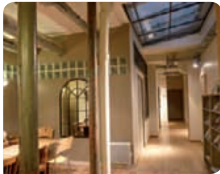
* Les nouveaux locaux de la Maison de la culture yiddish - Bibliothèque Medem

Principal centre européen de diffusion de la culture yiddish, la Maison de la Culture Yiddish – Bibliothèque Medem a pour objectifs de favoriser la conservation du patrimoine, de promouvoir le yiddish comme langue de culture et de privilégier sa connaissance auprès de publics issus de tous horizons, dans un esprit de laïcité et d'ouverture.