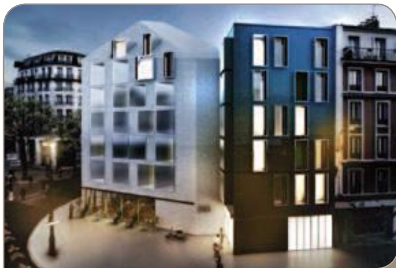
267 rue du Faubourg Saint-Martin : 16 logements sociaux