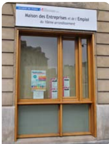
• La Maison des entreprises et de l'emploi du 10 e

En mars 2011, la mairie a également accueilli un Forum de l'emploi à destination des cadres, organisé en collaboration avec Pôle Emploi Magenta.