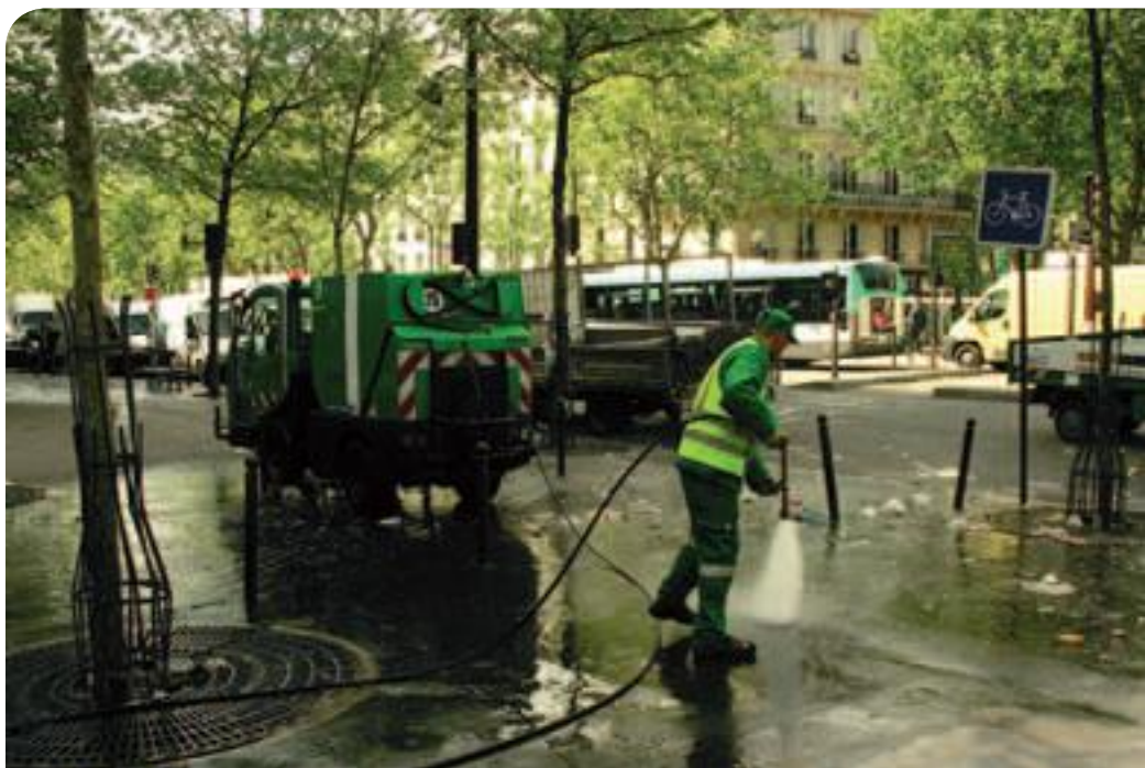
• Améliorer la propreté est une priorité de l'équipe municipale