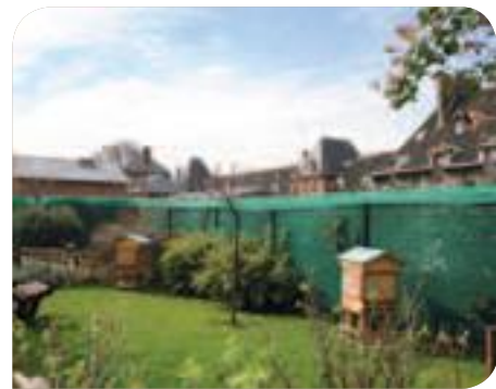
• Le rucher installé par l'Hôpital Saint-Louis et la Mairie du 10 e , pour préserver la biodiversité

Les services de la Ville portent une attention accrue aux rues les plus fréquentées, aux abords des gares, dans le quartier Château d'Eau, dans la rue du Faubourg Saint-Denis, le quartier de Belleville ou le long du canal Saint-Martin. Mais d'autres actions doivent permettre d'améliorer dans la durée une situation qui n'est pas encore satisfaisante :