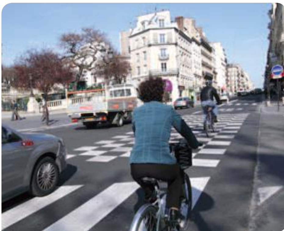
• La rue La Fayette après les travaux du Mobilien 26

La pollution, la saleté, les embouteillages ne sont pas une fatalité. Dans le 10 e comme dans tout Paris, nous avons fait le choix de privilégier les transports en commun et les circulations douces, en particulier le vélo, d'améliorer le confort des piétons et de végétaliser l'arrondissement chaque fois que cela est possible. Et la propreté reste une préoccupation constante.