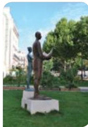
• Les sculptures de Cem Sagbil devant le square Alban Satragne

qui mène depuis plusieurs années des ateliers avec des publics en grande difficulté, l'occasion de montrer son travail d'artiste, dans une belle complicité avec une grande écrivaine.