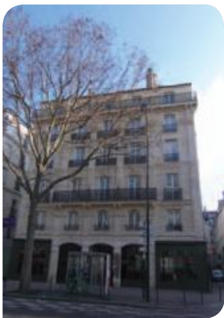
• Centre d'accueil des mineurs isolés étrangers, boulevard de Strasbourg