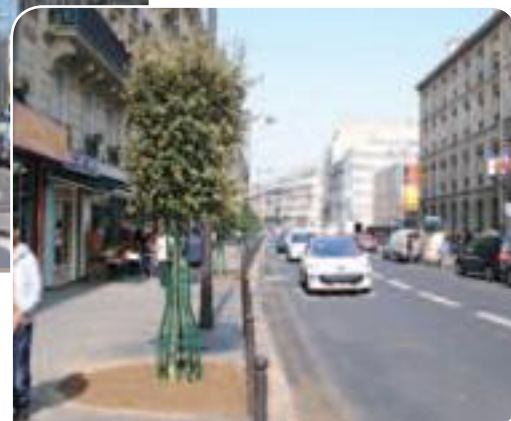
• Le haut de la rue du Faubourg Saint-Denis