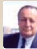
Tony Dreyfus Député de la 5 e circonscription (10 e arrondissement)