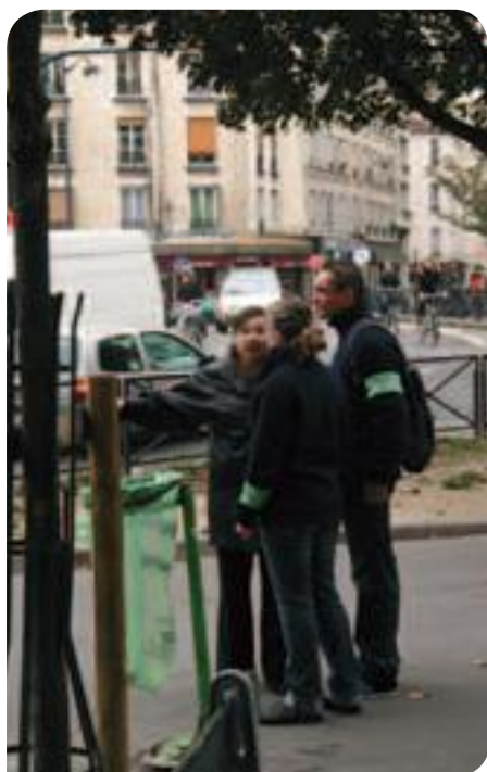
• Correspondants de nuit dans le 10 e