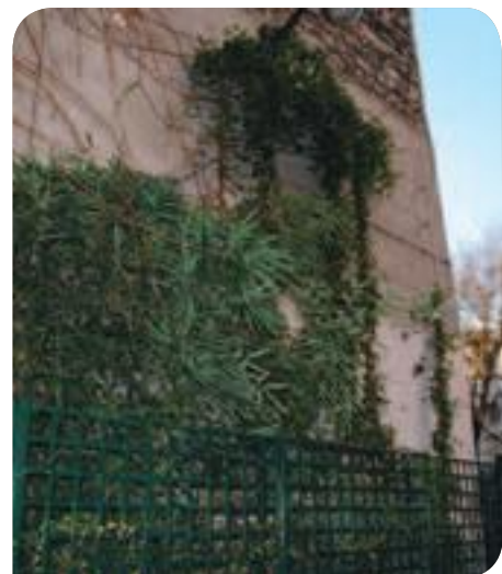
• Mur végétalisé, passage des Récollets