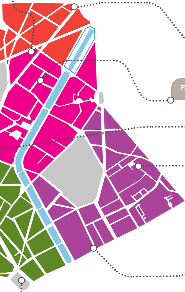
Passage Delessert : un gymnase et 69 logements sociaux