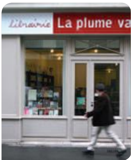
• La librairie La Plume vagabonde a ouvert rue de Lancry en 2009, grâce à la SEMAEST

Le 10 e est aujourd'hui au cœur de la transformation de Paris. Il accueille de nouveaux lieux culturels et de nombreux créateurs. Beaucoup d'entreprises et de commerces le choisissent pour s'implanter ou se développer. Ce dynamisme est une chance et nous voulons que tous les habitants puissent en bénéficier.