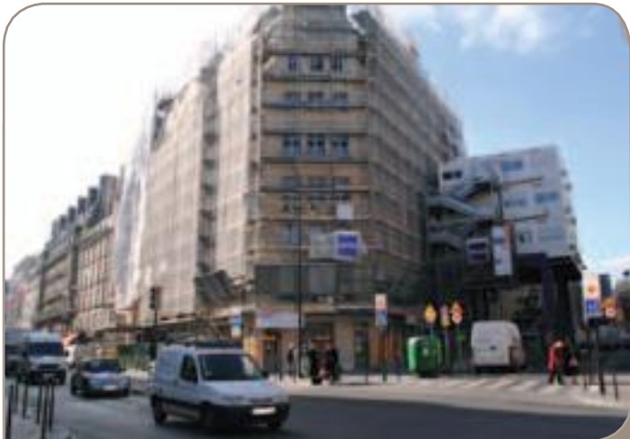
86 logements sociaux à l'angle des rues La Fayette et Louis Blanc