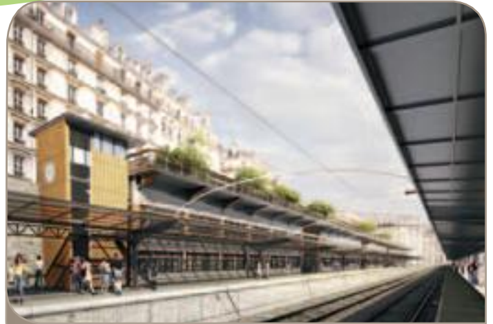
Le Balcon Vert