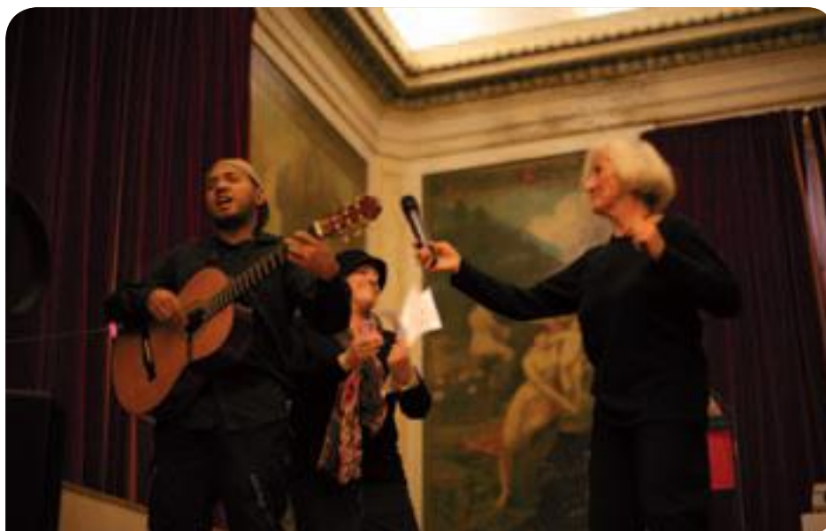
• 2 e anniversaire du conseil des seniors

Le Point Paris Émeraude de la Ville de Paris organise le suivi social des personnes âgées ainsi que le soutien à domicile de celles qui en ont besoin.