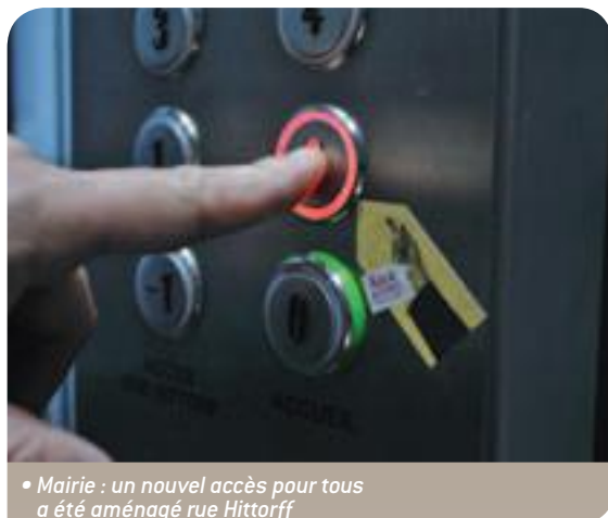
• Mairie : un nouvel accès pour tous a été aménagé rue Hittorff