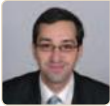
Rémi Féraud Maire du 10 e arrondissement