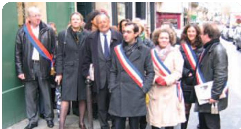
• Remise à Matignon de la pétition pour l'hébergement des exilés du 10 e