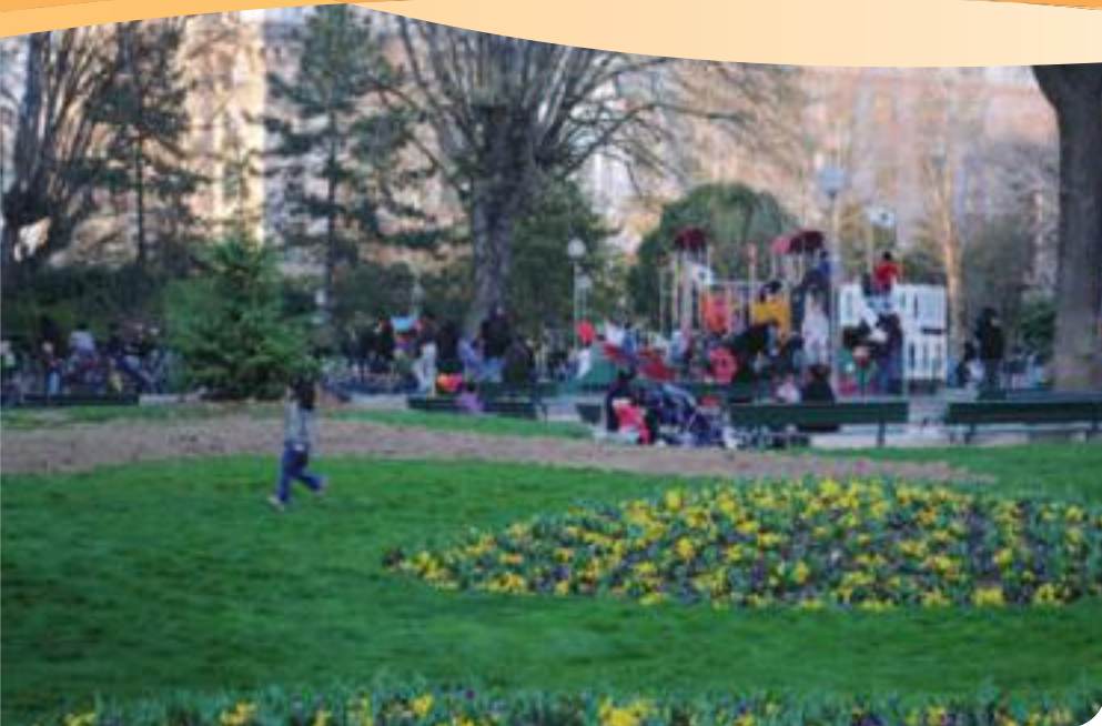
• L'aire de jeux pour enfants du jardin Villemin