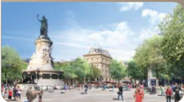
Réaménagement de la place de la République