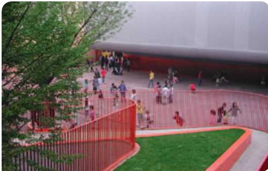
• Extension de l'école Lancry