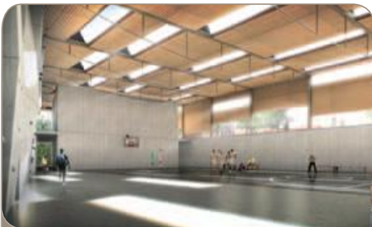
Ancien hôpital Saint-Lazare : un gymnase et une médiathèque

25-27 rue de l'Échiquier : 19 logements sociaux, une résidence sociale pour jeunes travailleurs et un jardin public