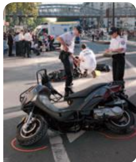
• Sécurité routière : reconstitution d'accident