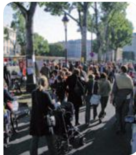
• La traditionnelle fête du canal d'Ensemble, nous sommes le 10 e