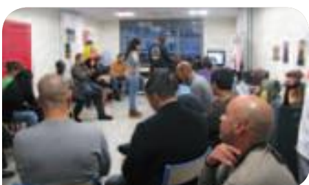
• Un « Grand conseil » de 10 e United

Un lieu d'accueil innovant et participatif pour tous les jeunes du 10 e a ouvert à la Grange-aux-Belles. Géré par l'association de prévention spécialisée AJAM, ce lieu, que les jeunes ont baptisé eux-mêmes 10 e United après un vote, est ouvert à des horaires flexibles, le soir et le week-end en particulier.