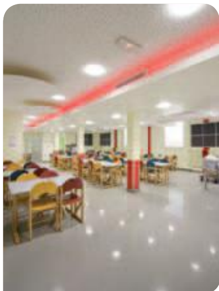
• Le nouveau réfectoire du collège Bernard Palissy