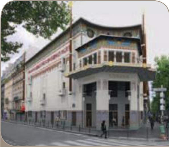
Le cinéma Le Louxor