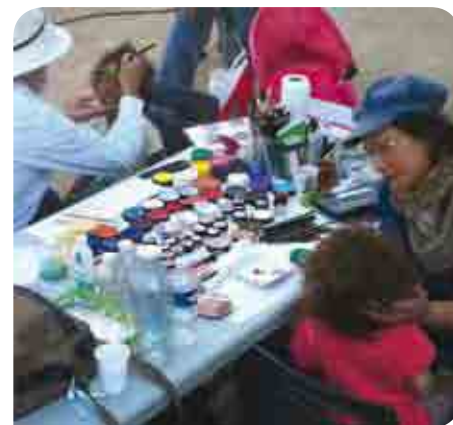
• Atelier de maquillage pour enfants durant le pique-nique

Dix sur Dix, le désormais traditionnel rendez-vous des associations du 10 e arrondissement, a eu lieu le week-end des 15 et 16 septembre, dans l'ancien Couvent des Récollets et le jardin Villemin, deux lieux emblématiques des luttes associatives des années 90.