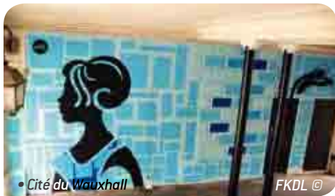
• Cité du Wauxhall