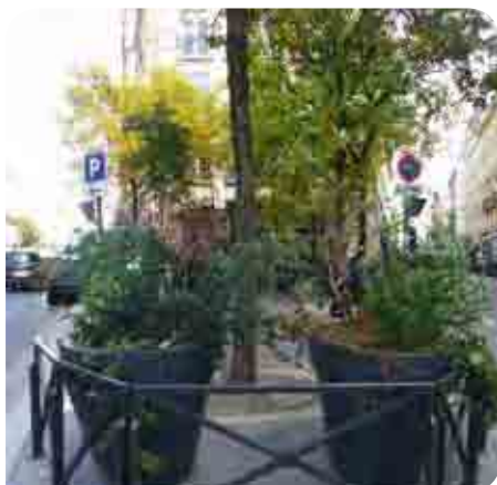
• Place du 8 novembre 1942, rue La Fayette

Certains lieux sont aménagés en concertation avec le conseil de quartier, comme à l'angle des rues Ambroise Paré et Guy Patin (voir photo ci-contre). L'arrosage et l'entretien sont assurés par la régie de quartier du 10 e ou parfois par les riverains eux-mêmes (rue Gustave Goublier ou, bientôt, passage Dubail).