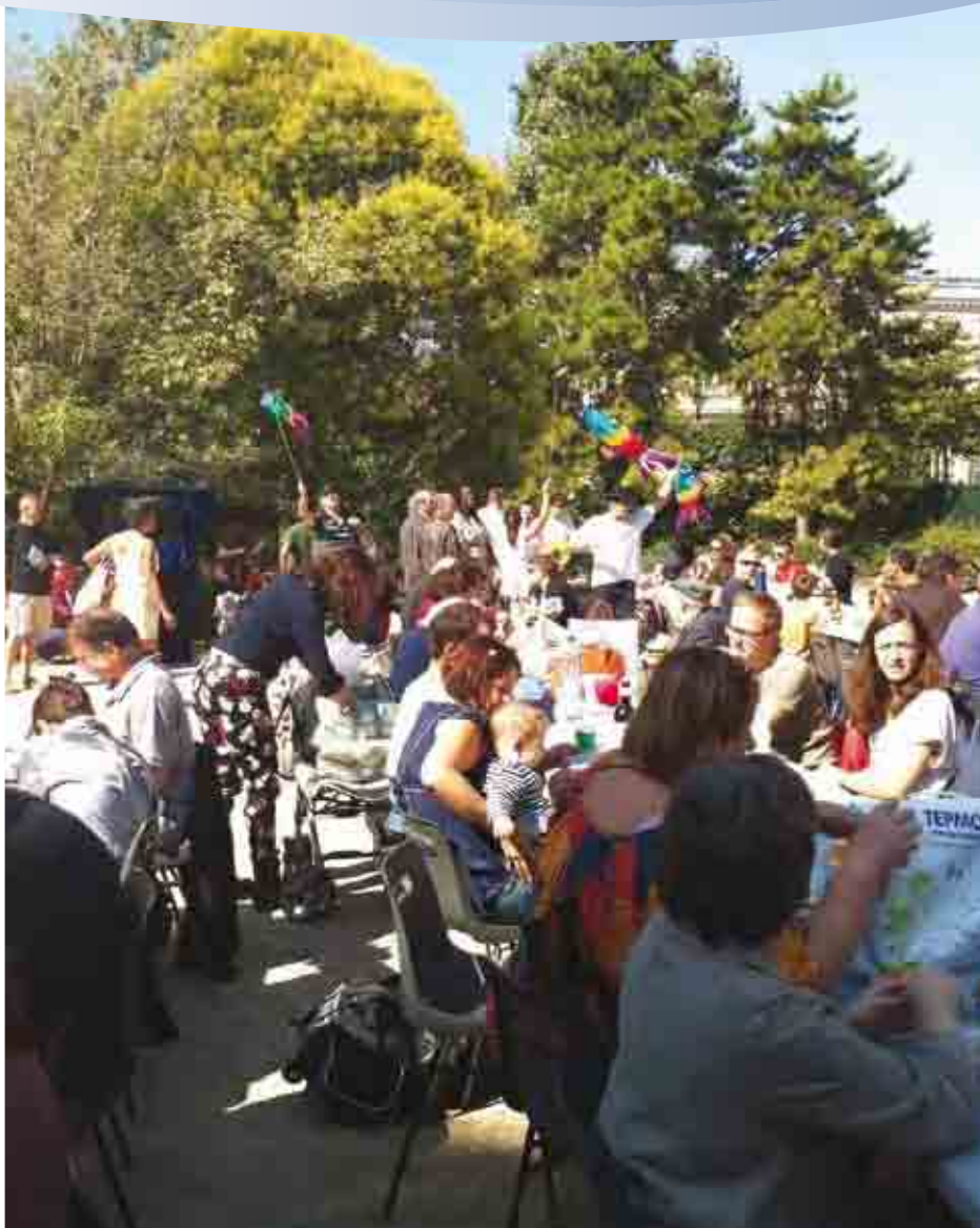
• Pique-nique organisé par les six conseils de quartier