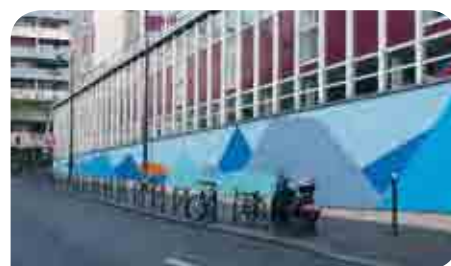
• Rue Alibert (école Parmentier)

Projet lancé en 2010 par le Conseil de Quartier Hôpital Saint-Louis - Faubourg du Temple, avec l'appui de la Mairie du 10 e arrondissement, « les 3 murs » a ouvert la voie. Tous les trois mois, chaque mur est confié à un nouvel artiste. Ce dernier assure la réalisation d'une fresque en collaboration avec un collectif local (association, groupe scolaire, collectif mitoyen), qui participe au projet artistique.