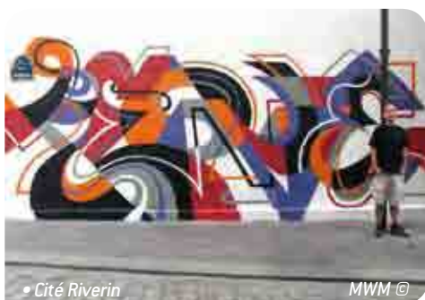
• Cité Riverin