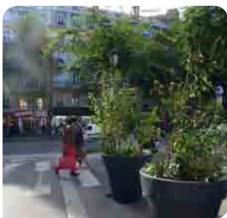
• Angle des rues Guy Patin, Ambroise Paré et du Boulevard de Magenta