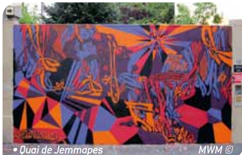
• Quai de Jemmapes

La méthode : quand un mur est identifié, la mairie prend contact avec la copropriété pour obtenir son aval (sauf bien entendu quand les locaux appartiennent à la municipalité), la galerie propose à un de ses artistes d'intervenir sur le mur (FKDL, Matt W Moore...), les services de la Ville, si nécessaire, nettoient la surface au préalable et la mairie du 10 e prend à sa charge le coût de la peinture.