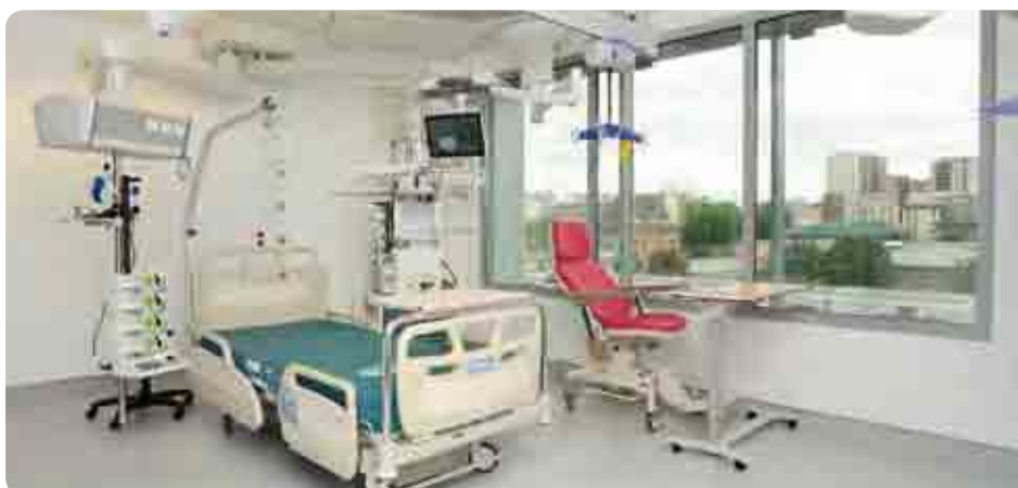
• Les chambres individuelles sont équipées pour permettre la réanimation et les soins chirurgicaux

La concrétisation de ce projet innovant est un beau succès pour le groupe hospitalier Saint-Louis Lariboisière Fernand Widal et améliorera considérablement la prise en charge des grands brûlés parisiens.