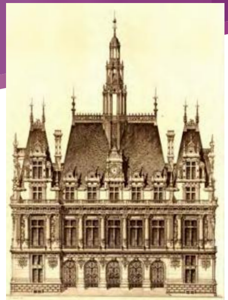
Façade de la Mairie

et l'on distingue le navire emblématique de la capitale et sa devise : « Fluctuat nec mergitur ». Sur le toit du campanile, des caprices de zinc s'entrelacent en coquetteries diverses où l'on devine les mots « République Française ». Au-dessus du cadran de l'horloge et de ses élégantes cariatides, un coq gaulois chante victoire. Le 10 e peut se proclamer républicain, il possède désormais une mairie ambitieuse, elle a enfin trouvé à se fixer après ses multiples vagabondages depuis la Révolution. On dit qu'elle fut la plus coûteuse de toutes les mairies parisiennes. La République, particulièrement sensible à la valeur éducative de l'architecture, sait que la maîtrise du langage des signes est un outil essentiel de l'art du politique.