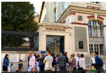
Rentrée scolaire à l'école de la rue Vicq d'Azir