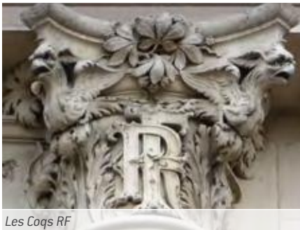
Les Coqs RF

Ce jour-là, Eugène Rouyer, l'architecte de la nouvelle mairie, reçoit la légion d'honneur. Il a participé au concours de l'Hôtel de Ville de Paris où il est arrivé deuxième. La reconstruction du prestigieux monument, pastiche de celui conçu au début du XVI e siècle et incendié sous