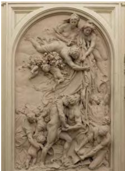
Haut-relief de Jules Dalou

Ils sont généreusement parsemés sur les façades. Des crêtes légères et capricieuses encadrent la lettre « P » du mot Paris, des cartouches affichent le monogramme « RF »