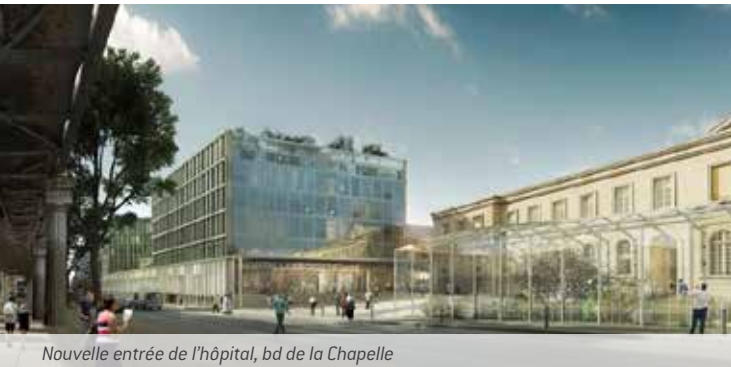
Nouvelle entrée de l'hôpital, bd de la Chapelle