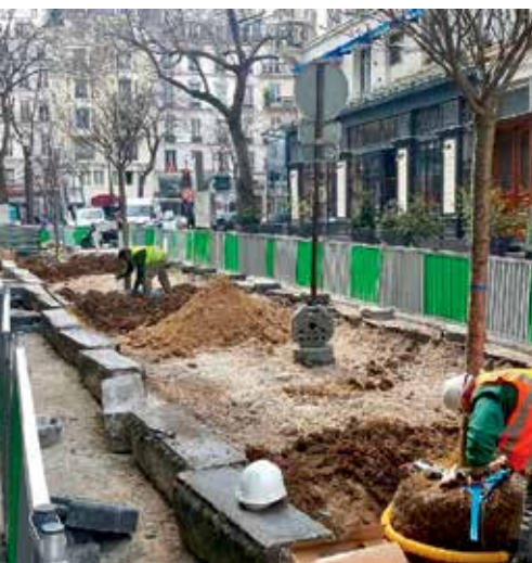
Plantation des arbres de l'impasse Bonne Nouvelle menant au jardin