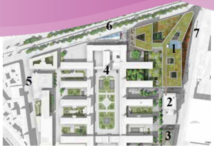
Plan du Nouveau Lariboisière

1 : bâtiment du Nouveau Lariboisière - 2 : bâtiment Galien - 3 : bâtiment Morax 4 : bâtiments historiques - 5 : rue Guy Patin - 6 : Boulevard de la Chapelle 7 : rue de Maubeuge