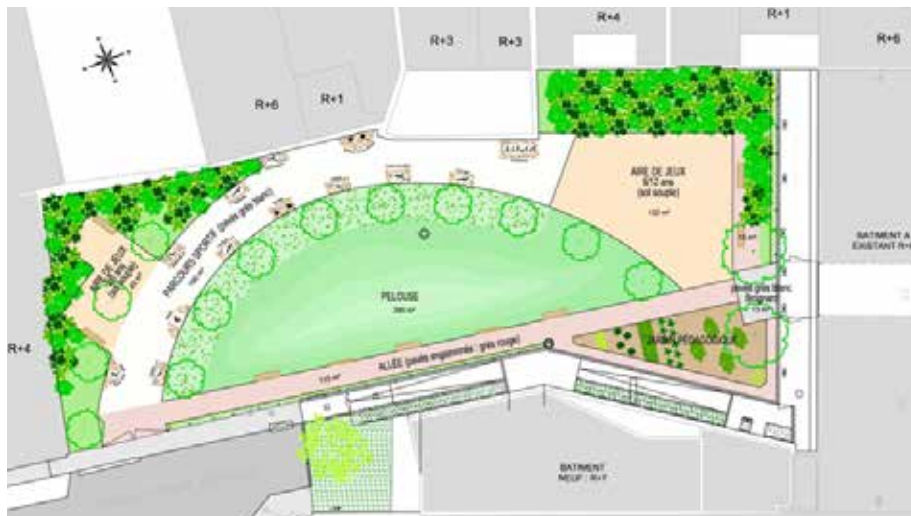
Plan du jardin de l'Échiquier

Ouverture en juillet à partir de 8h en semaine et 9h le week-end, et jusqu'à 20h30 du 1 er mai au 31 août. Plus d'informations sur place.