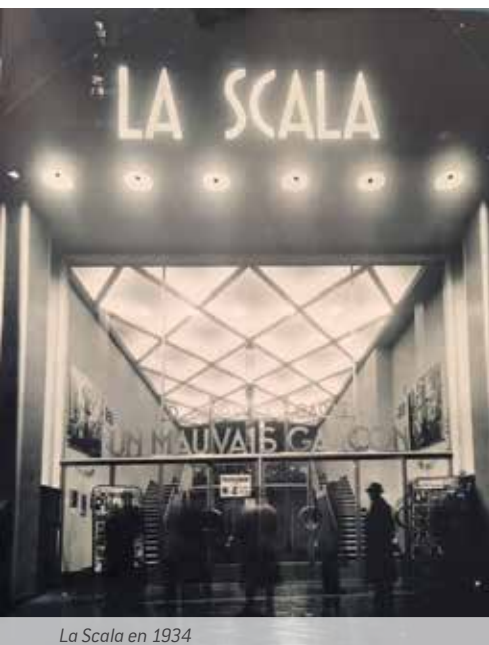
La Scala en 1934

Il n'y a pas meilleur endroit. Le quartier du Boulevard de Strasbourg et des Portes était appelé le « Quartier des Chansons » par Maurice Chevallier. Il comptait des dizaines de théâtres, de salles de spectacles, de concerts au début du XX ème siècle et est encore très dynamique aujourd'hui. C'est un environnement très diversifié, tant dans sa population que dans ses activités. Un lieu aussi cosmopolite et ouvert est parfait pour une salle comme la Scala, qui retrouvera l'esprit de mélange et de liberté qui faisait son succès et son prestige dès le milieu du XIX ème siècle. Le quartier se sentira chez lui dans cette salle, et la nouvelle Scala sera ici chez elle.