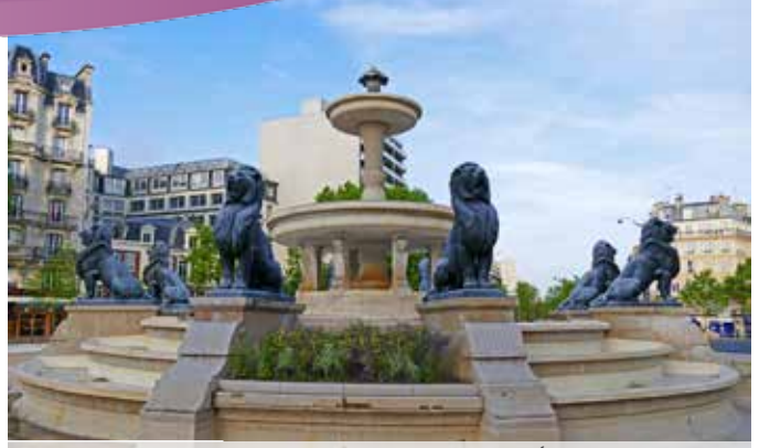
La deuxième fontaine aux lions de la place du Château-d'Eau (Actuellement au milieu de la place Félix Eboué)