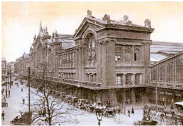
Gare du Nord en 1914, les taxis, Coll. LAMMING Publiée par Direct Matin – 18 avril 2014

J'avais publié il y a une vingtaine d'années un ouvrage sur la Gare de l'Est, voici aujourd'hui l'histoire de la Gare du Nord.