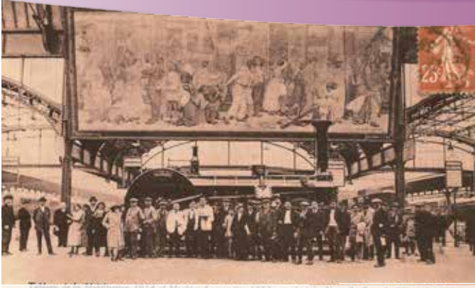
Le tableau d'Albert Herter à la gare de l'Est (Accrochage originel sur le quai transversal, juste près des heurtoirs) Cliché 7 Septembre 1932