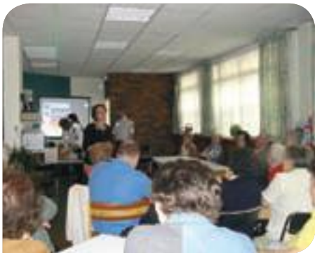
• Réunion d'information sur le dispositif tranquillité Seniors

La Ville de Paris met gratuitement à la disposition des seniors un service d'accompagnement pour effectuer, en toute tranquillité, des opérations de retrait ou de dépôt de fonds auprès de leur bureau de poste, de leur banque ou d'un distributeur automatique de billets.