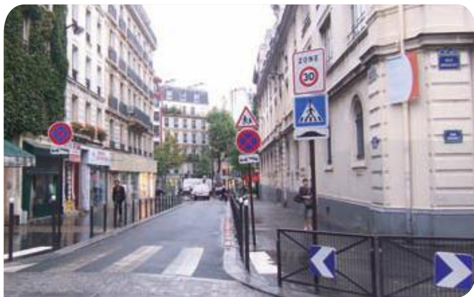
• Rue de Belzunce

La rue de Belzunce , où se trouve une école élémentaire, a été sécurisée par la création de 2 passages piétons surélevés au niveau des croisements de la rue de Belzunce avec les rues Fénelon et Saint-Vincent de Paul. Deux zones de stationnement ont été créées, au niveau du n°5 rue de Belzunce et du n°1 rue Saint-Vincent de Paul.