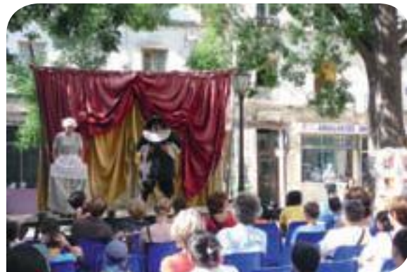
• Festival des arènes de Montmartre 2009, organisé par la Compagnie du Mystère Bouffe.

Que ce soit pour un cours de danse pour votre enfant, des répétitions d'un groupe musical entre amis ou une initiation au théâtre ou à la photographie, nombreux sont ceux qui ont eu l'occasion ou l'envie de fréquenter les lieux qui offrent ces possibilités.