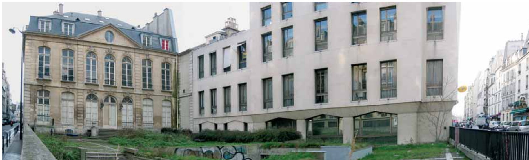
Hôtel Choiseul-Praslin et bâtiment de la Poste rue de Sèvres Emplacement du futur siège de la Banque postale – Architectes : Chaix et Morel

Enfin, une ligne de transport reliant les gares et notamment la gare Montparnasse sera mise à l'étude.