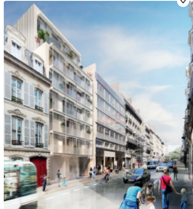
Rue d'Amsterdam Bâtiment à l'alignement Façade avec balcons Revêtement clair Aspect lumineux, contemporain