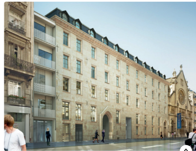
Rue de Saint Pétersbourg Ravalement de la façade en pierre de taille Recomposition des baies et des accès Élargissement des lucarnes