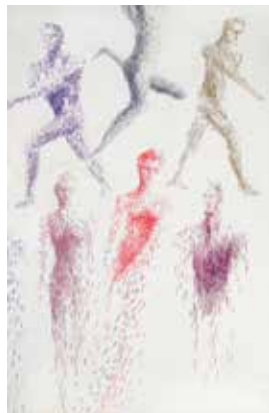
DANSE - 89x130 cm

Entrée libre du lundi au vendredi 10h30 > 17h, jeudi jusqu'à 19h, samedi 10h > 12h