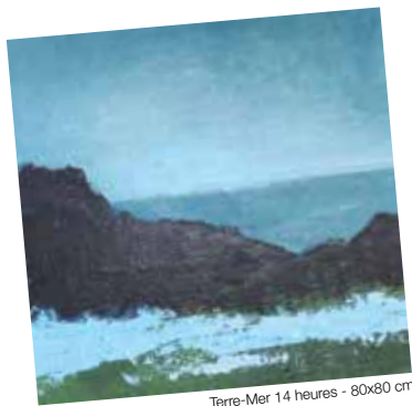
Terre-Mer 14 heures - 80x80 cm

À mesure que les toiles de Sophie Cérésa se succèdent, les paysages et natures mortes défilent sous le regard du spectateur. Une peinture d'une sensibilité saisissante qui arrête le temps et mérite que l'on lui en donne.