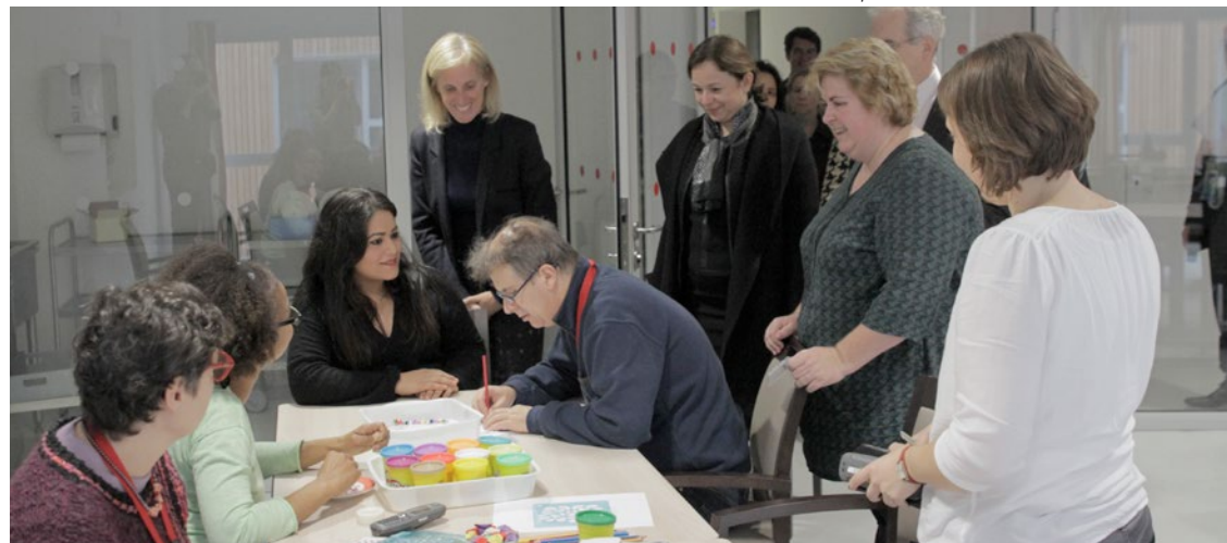
Visite du pôle médico-social "la Planchette"

Ouverture d'un foyer de 35 places pour personnes âgées en situation de handicap rue Mousset Robert, par l'association des centres Pierre et Louise Dumonteil.