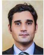
Régis Peutillot Adjoint à la Maire chargé de la démocratie locale