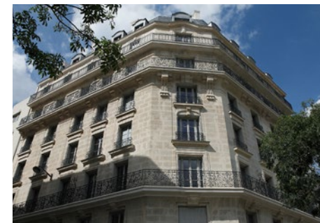
23 nouveaux logements sociaux au 69 boulevard Poniatowski

Nouveau Conseil Local de l'Habitat à Erard-Charenton.