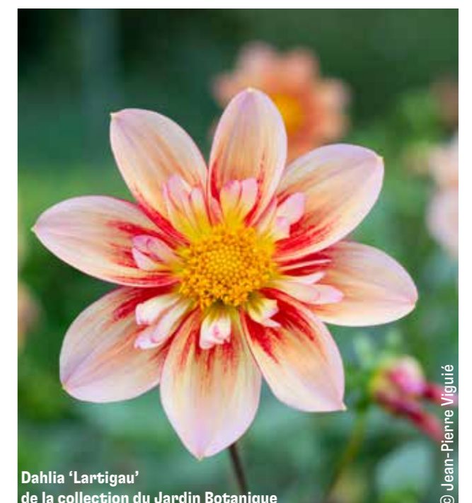
Dahlia 'Lartigau' de la collection du Jardin Botanique