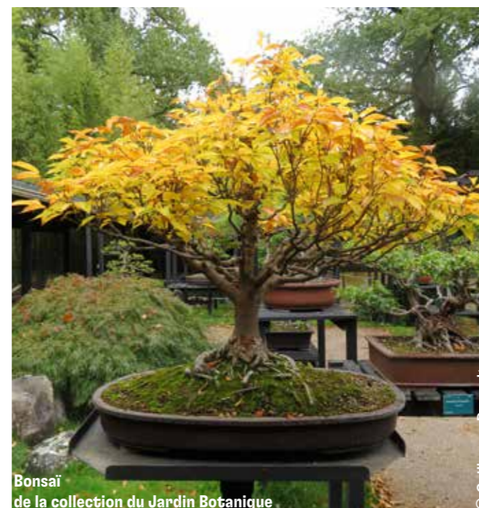
Bonsaï de la collection du Jardin Botanique