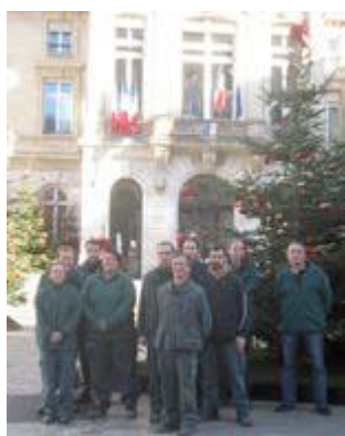
Les jardiniers du service des espaces verts posent devant la décoration de Noël du parvis de la Mairie.

Le centre de production horticole municipal assure tout au long de l'année la production des végétaux qui viennent agrémenter et fleurir Paris. Chaque année, la Ville de Paris organise une vente des surplus du centre de production. La prochaine se déroulera au square Saint-Lambert, samedi 12 mars de 14h à 17h. Les amateurs pourront acheter des arbustes à racines nues au tarif unique de 1€ avec un maximum de cinq arbustes par personne.