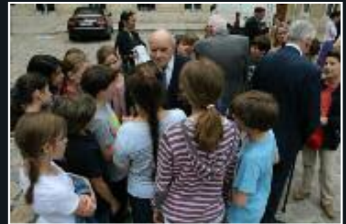
Le 18 juin, commémoration de l'appel du 18 juin 1940. 7