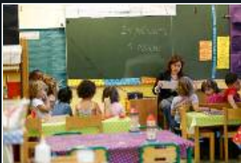
Le 3 septembre, rentrée scolaire. 7