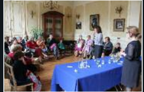
Le 29 mai, atelier sur les parfums Annick Goutal à l'occasion de la fête des mères. 7