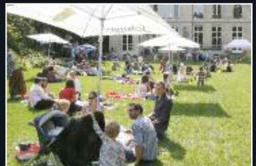
Le 8 septembre, Déjeuner sur l'herbe dans le jardin de la mairie. 7