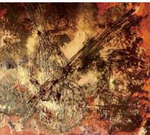
© III LE VIOLON • TABLEAU DE SHANA AGHION

Dans le passé, Shana Aghion a également contribué à la survie de l'orgue d'Auteuil dans le 16 e arrondissement mais aussi à de nombreuses causes solidaires et humanitaires à travers le monde.