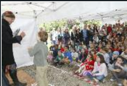
Le 26 juin, grande fête de fin d'année des enfants en présence d'Astérix et Obélix et du magicien du Parc Astérix ! 7