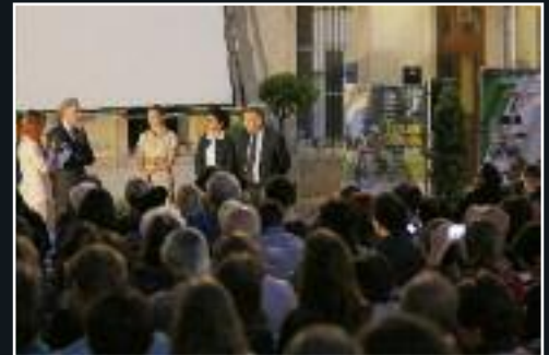
Le 11 juin, soirée de clôture du 12 e Festival le 7 e art dans le 7 e , en présence de Clotilde Courau. 7