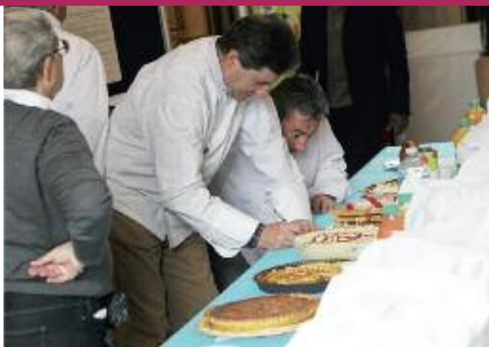
7 À L'AGENDA : CONCOURS DE CUISINE (P.16)