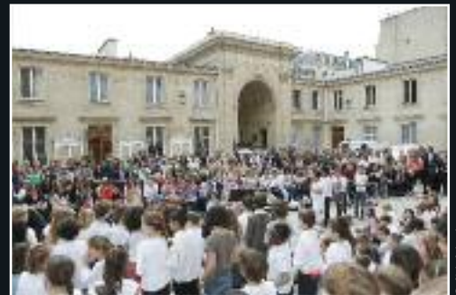
Le 27 juin, concert de fin d'année des écoles Eblé et Duquesne. 7