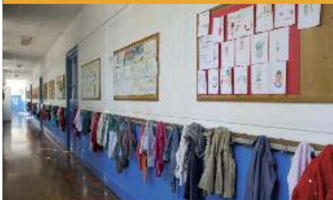
7 UN DOSSIER : UNE RENTRÉE HAUTE EN SOLIDARITÉ ! (P.5)

Conformément à la loi sur le financement des campagnes électorales qui encadre rigoureusement la communication publique pendant l'année précédant un scrutin, nous ne publions pas le traditionnel éditorial de la mairie du 7 e arrondissement et nous ne publierons plus qu'un agenda culturel tous les deux mois, jusqu'à l'élection municipale de mars 2014.