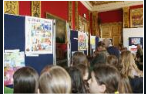
Le 25 juin, remise des prix du concours de bandes-dessinées. 7