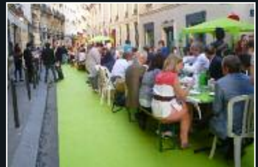
Le 19 juin, dîner de rue de l'association Le Faubourg Saint-Germain*. 7