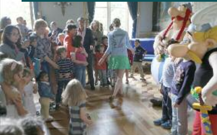
7 ARRIVÉ : GRANDE FÊTE DE FIN D'ANNÉE (P.12)