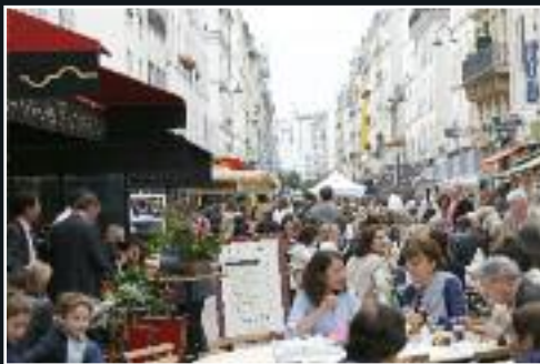
Le 27 juin, dîner de la rue Cler. 7