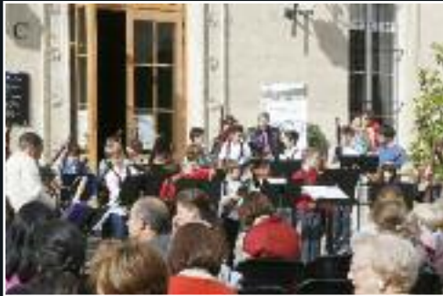
Le 21 juin, fête de la musique et clôture du Festival 7 en musique. 7