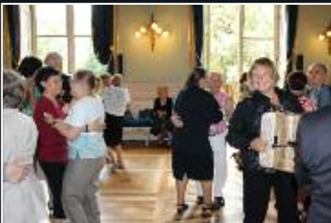
Le 19 juin, Bal des seniors du CMASS. 7