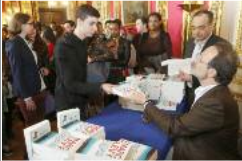
Le 28 mai, remise du dernier ouvrage de Marc Lévy aux lycéens méritants. 7