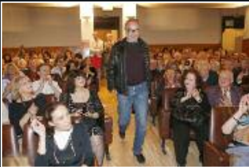
Le 13 juin, Présentation d'Alceste à bicyclette par Fabrice Luchini dans le cadre du Festival. 7