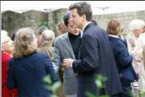
Le 9 juin, fête de la paroisse Sainte Clotilde dans le jardin du lycée Paul Claudel. 7