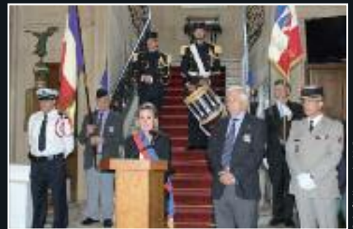
Le 26 août, commémoration de la libération de Paris. 7