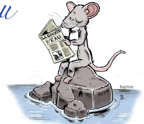
La souris Suzy

Guillaume 1er d'Orange-Nassau (1533-1584)