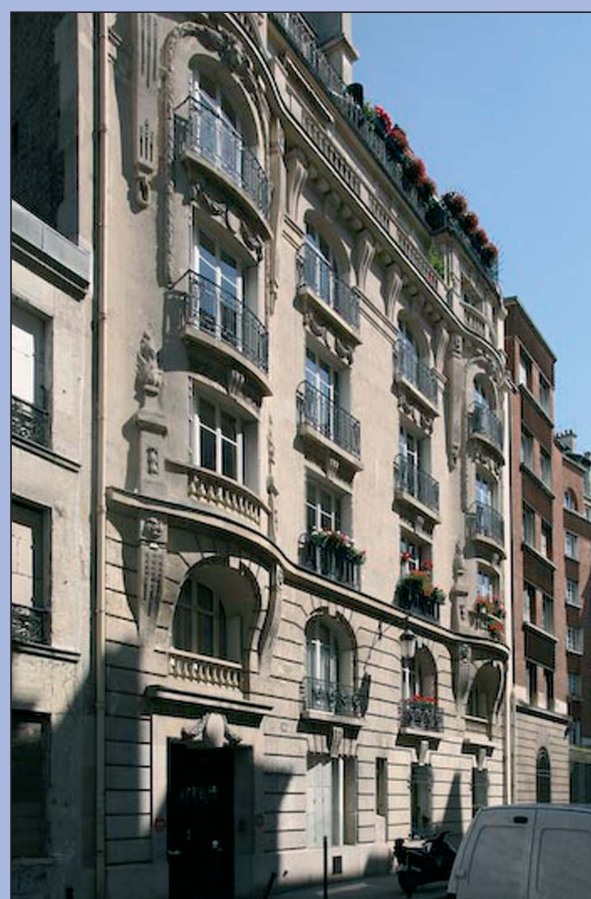
10 rue Oudinot - 7 e