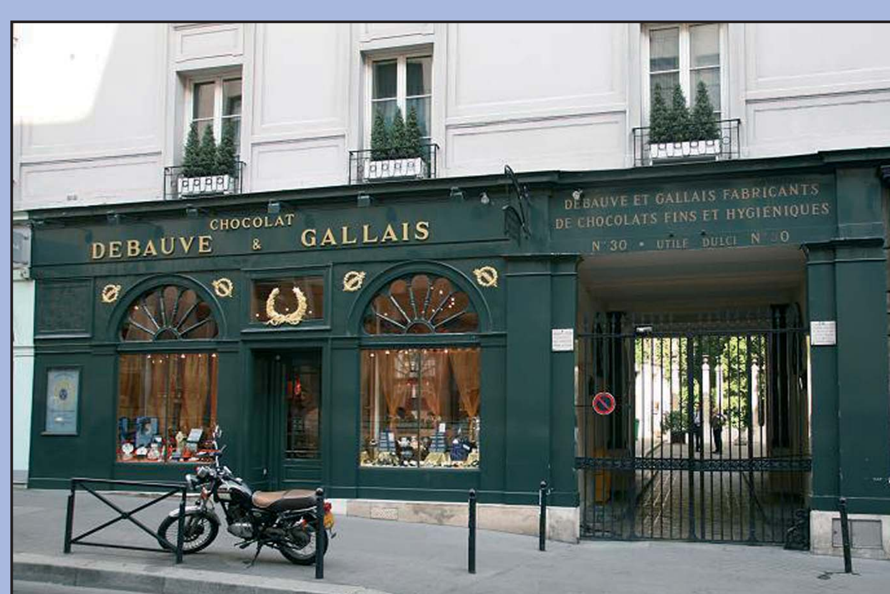
30 rue des Saints-Pères - 7 e