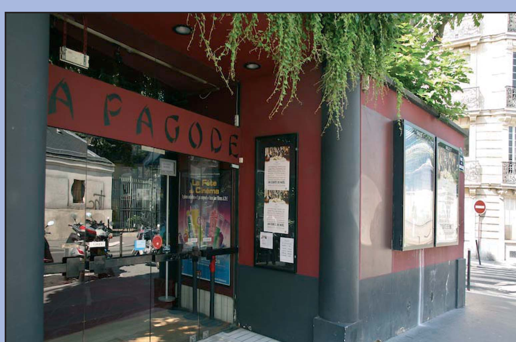
1 rue Monsieur / 57 rue de Babylone - 7 e

en cohérence avec les objectifs définis dans le PLU de Paris pour assurer la diversité des fonctions urbaines et protéger le commerce et l'artisanat.