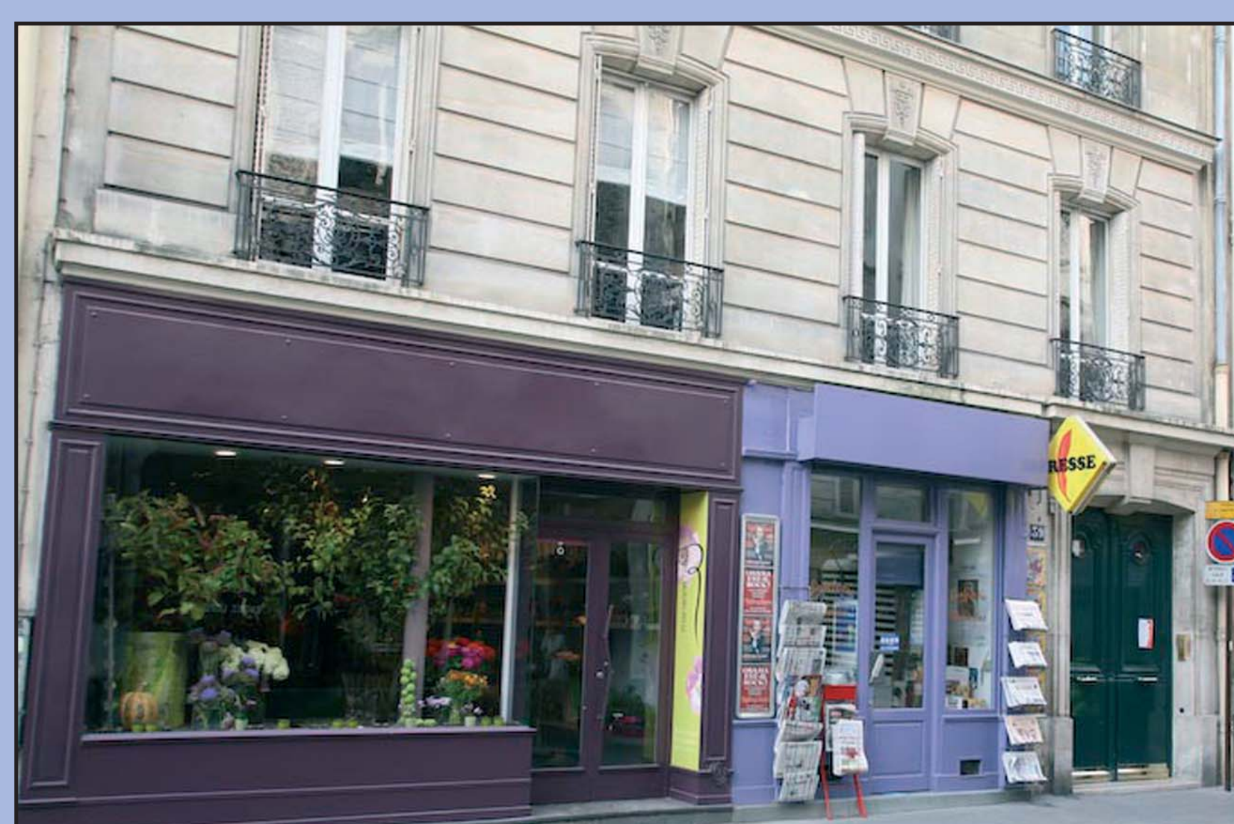
39 rue de Babylone - 7 e