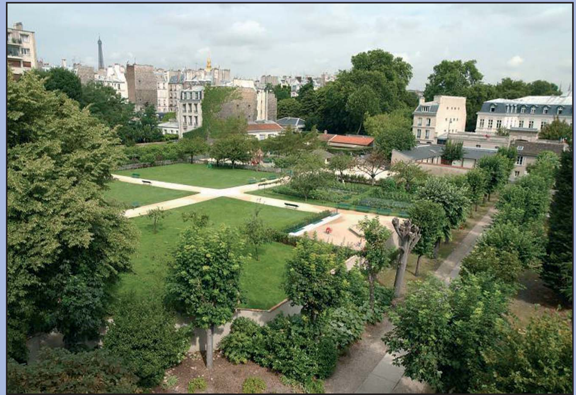
Jardin Catherine Labouré - 7 e

de mettre le PSMV en cohérence avec le Plan d'Aménagement et de Développement Durable (PADD) du Plan Local d'Urbanisme de Paris et notamment de traduire sur le territoire du 7 e arrondissement les objectifs de la Ville en termes de logement, de développement économique et d'environnement.