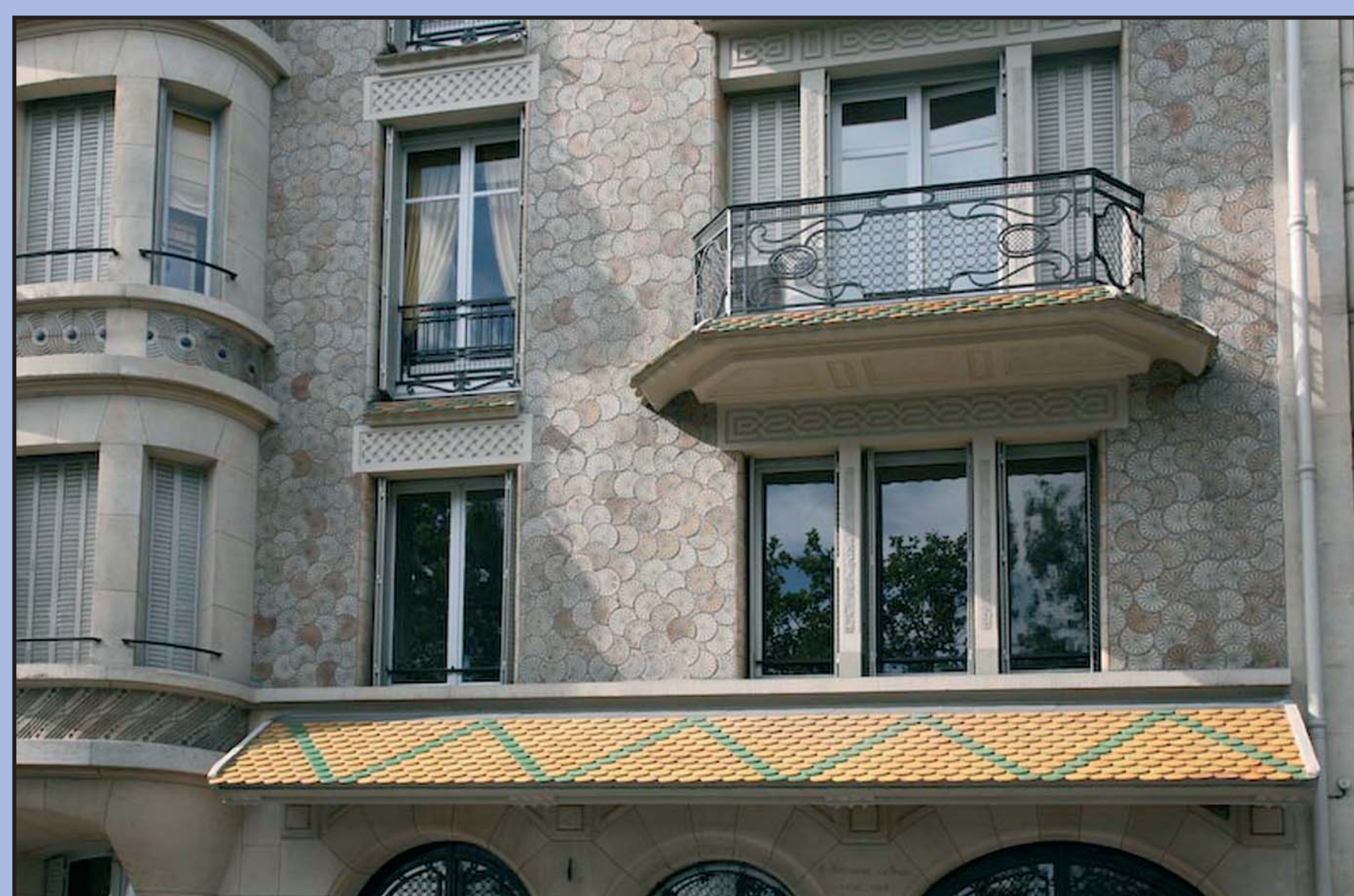
27-29 quai Anatole France - 7 e

avec un inventaire prenant également en compte l'architecture des XIX e et XX e siècles et affiner les prescriptions sur les bâtis anciens et sur les jardins pour une meilleure conservation et mise en valeur.