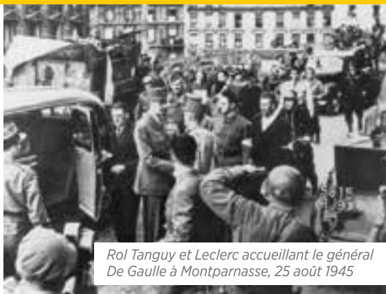
Rol Tanguy et Leclerc accueillant le général De Gaulle à Montparnasse, 25 août 1945