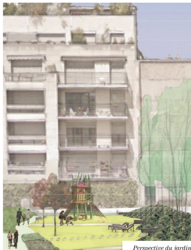
Perspective du jardin