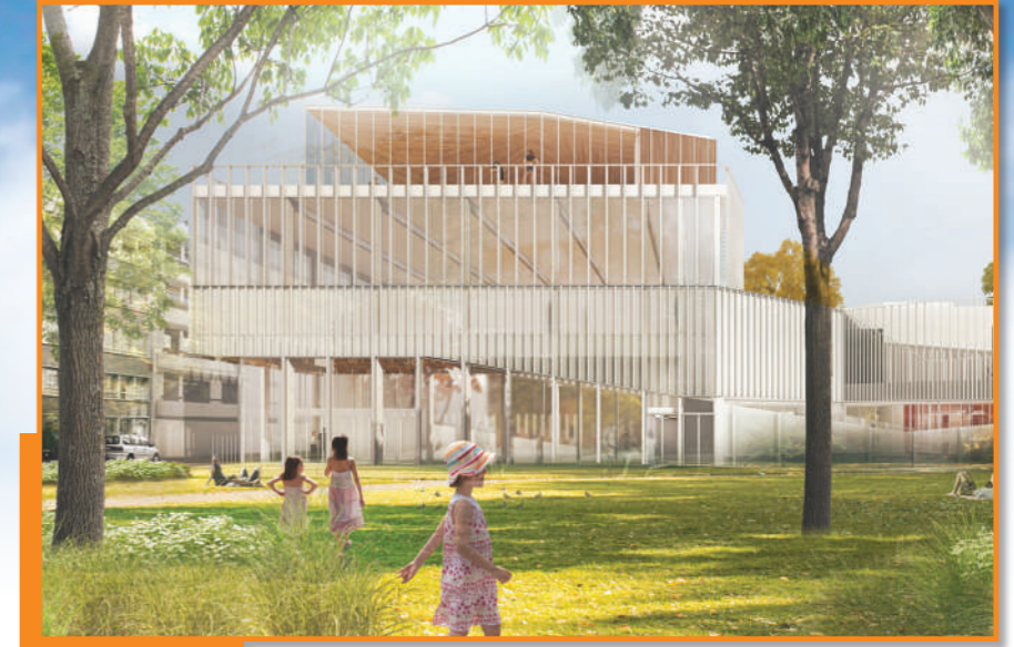
Trois salles de sport dominant sur le jardin