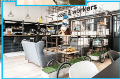
En rez-de-chaussée, de nouveaux commerces