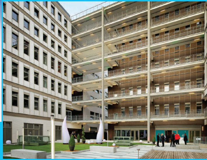
Publicis s'installe dans les 22 000 m 2 de bureaux