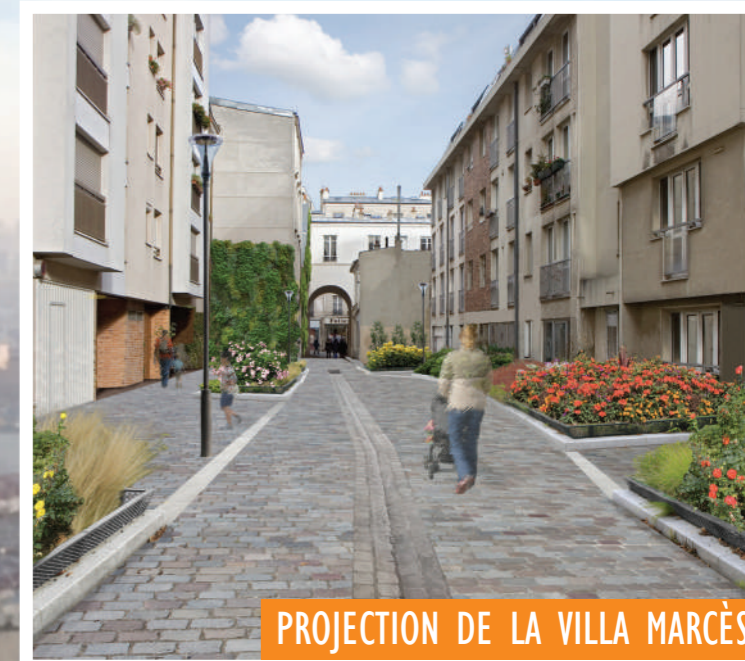
PROJECTION DE LA VILLA MARCÈS