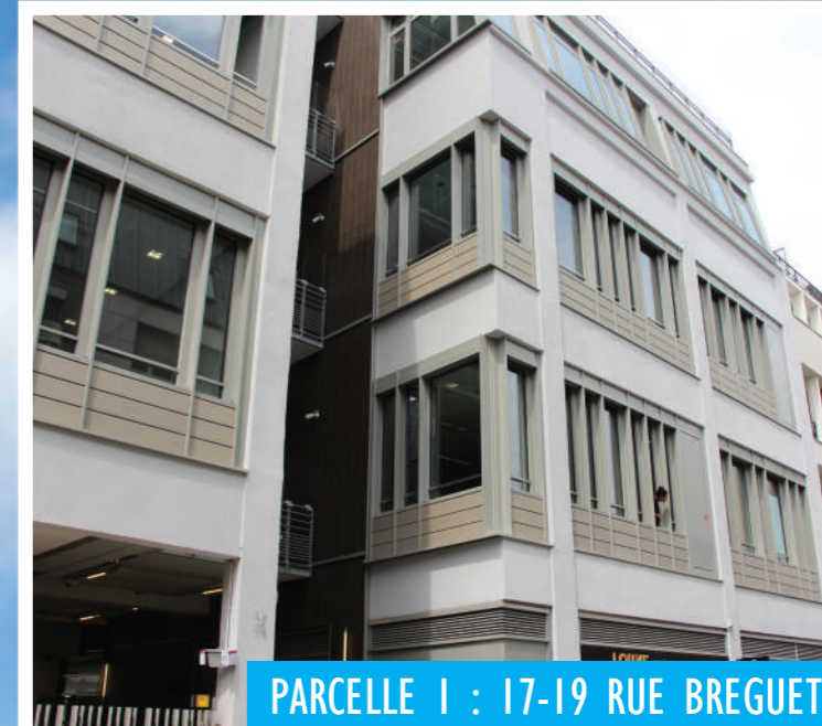
PARCELLE 1 : 17-19 RUE BREGUET