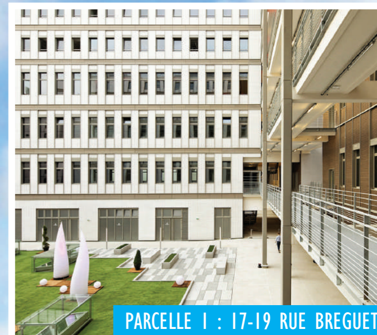
PARCELLE 1 : 17-19 RUE BREGUET