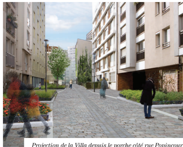
Projection de la Villa depuis le porche côté rue Popincourt

Du mobilier urbain (bancs, chaises longues) sera installé. Les enfants pourront profiter d'une aire de 145m 2 dédiée aux jeux de grimpe, d'adresse et d'équilibre. Une fontaine à eau se trouvera à proximité. Le jardin comportera également une quinzaine d'arbres, de tailles et d'essences variées .