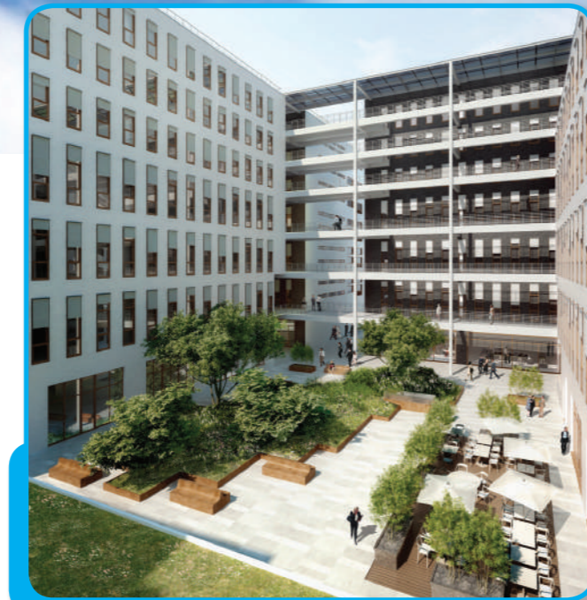
vue sur la grande cour végétalisée