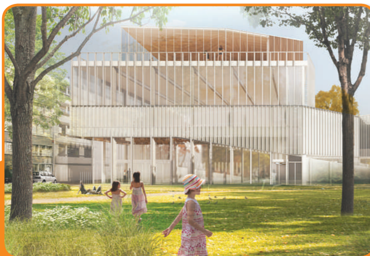
3 salles de sport dominant sur le jardin