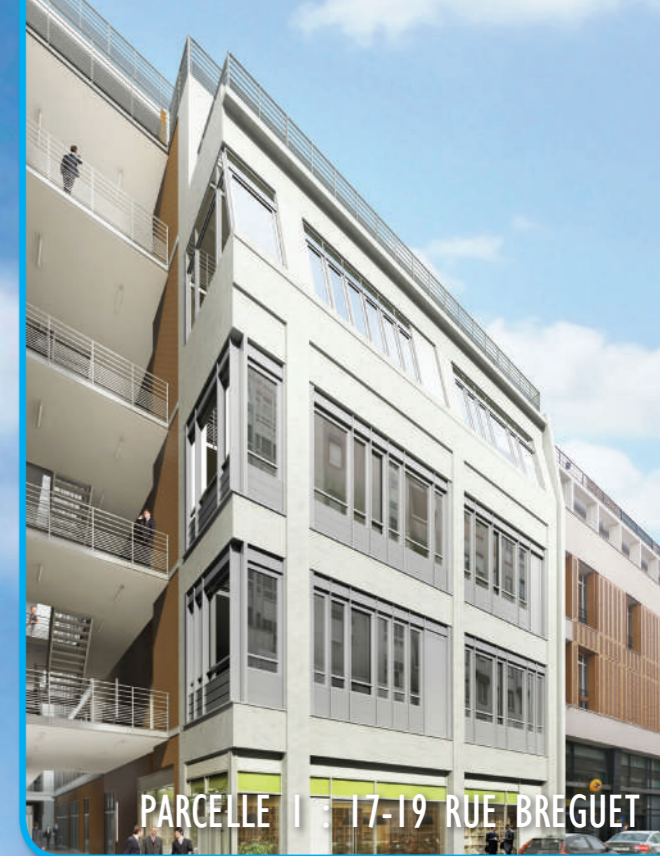
PARCELLE 1 : 17-19 RUE BREGUET

François VAUGLIN Maire du 11 e arrondissement