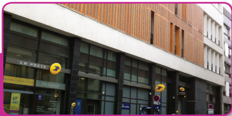
une réhabilitation complète de l'immeuble