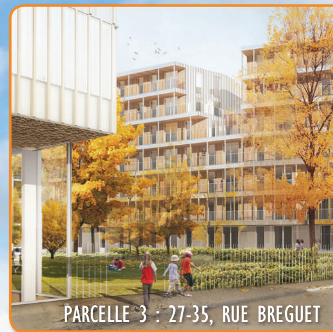
PARCELLE 3 : 27-35, RUE BREGUET