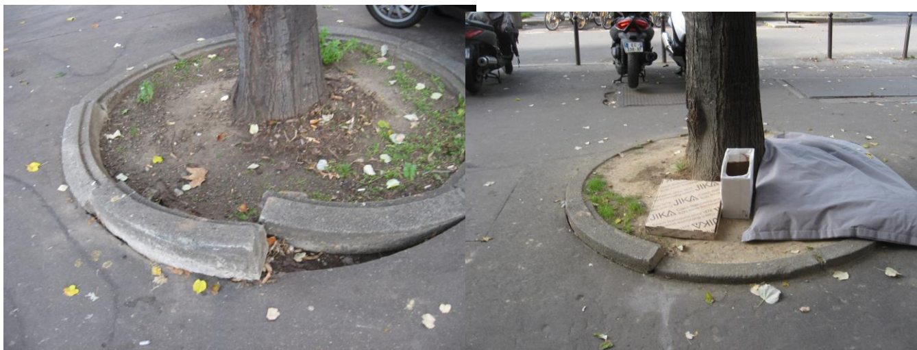
Bordures pied d'arbre placette vers le 46 bd du Temple (signalé le 18/10/16)