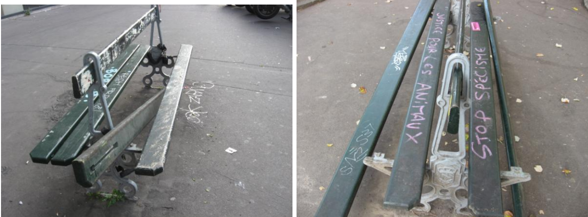
Bancs vers le 46 Bd du Temple (déjà signalé le 18/ 10/ 16)