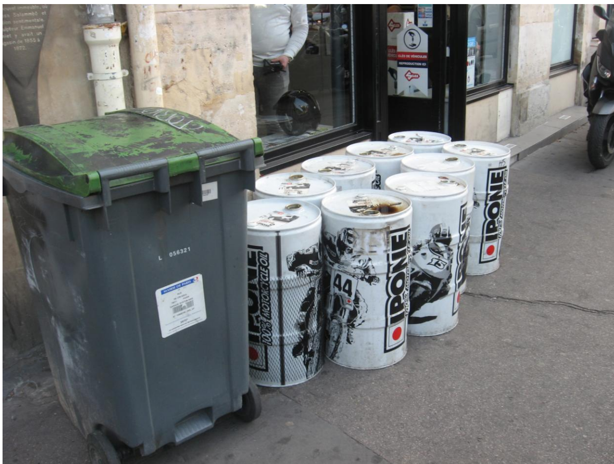
Magasin moto bd du Temple