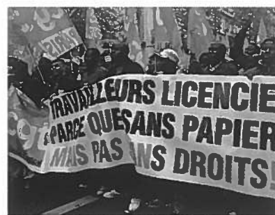
1 er mai 2008