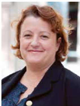
Frédérique Calandra Maire du 20 e