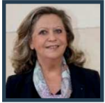
Danièle GIAZZI Maire du 16e arrondissement