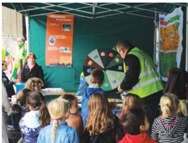
Les services de la propreté présentent leurs actions aux élèves de l'arrondissement durant la Fête de la propreté.

En liaison étroite avec la Mairie du 6 e arrondissement, le service de Propreté du 6 e réalise de nombreuses actions de communication et de sensibilisation sur les thèmes de la propreté, du tri et de la prévention des déchets. Organisées sur la voie publique et dans les écoles, ces opérations répondent au plan d'action validé par la Mairie du 6 e .