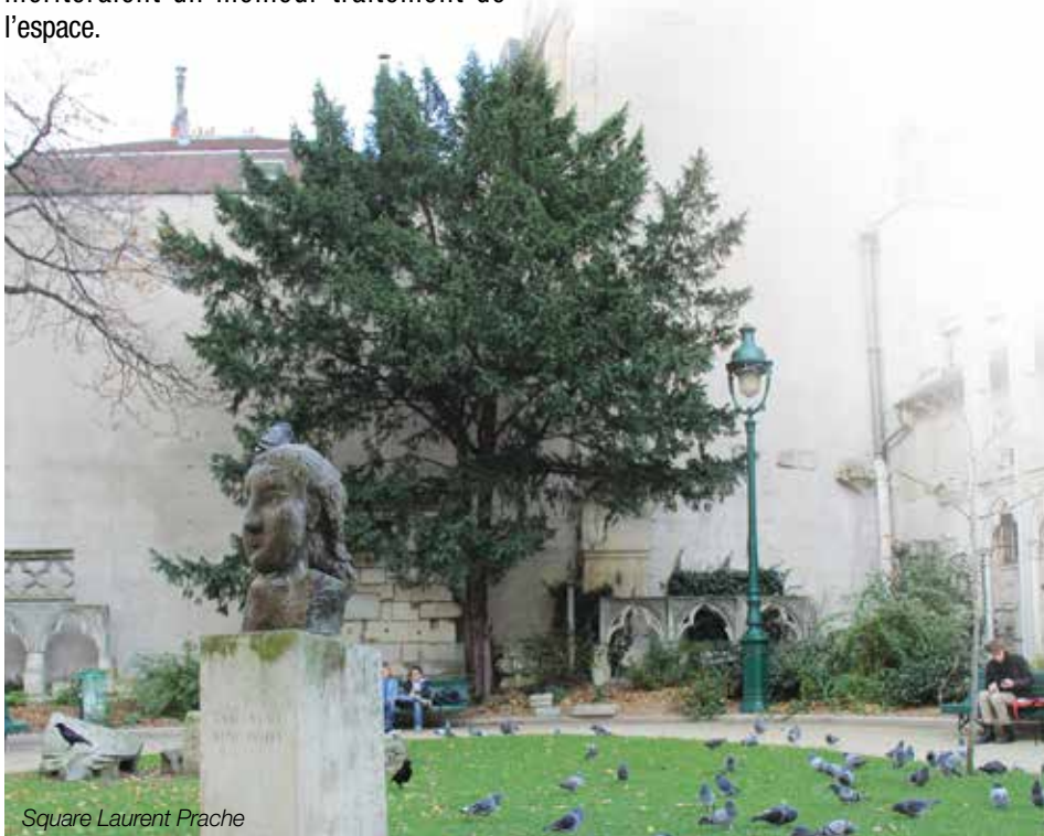
Square Laurent Prache

Enfin le Conseil de Quartier a également participé aux côtés de « l'association rue Visconti-des-prés » et de sa dynamique Présidente, à toute une série d'animations qui ont rencontré un grand succès.