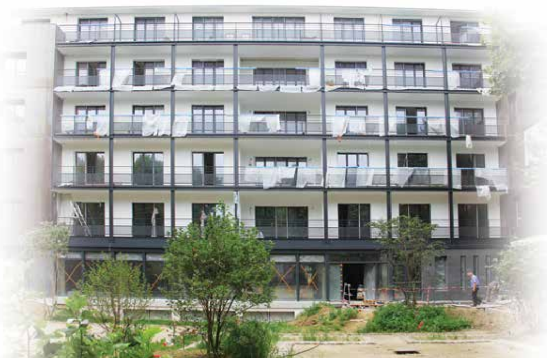
Façade du futur EPHAD situé 88 rue du Cherche Midi