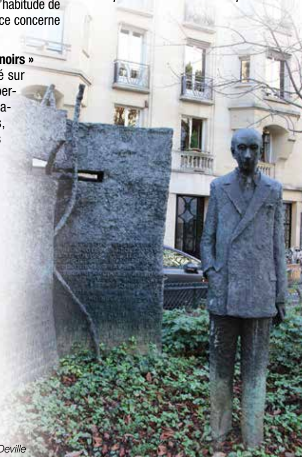
Place Alphonse Deville

Le Conseil de Quartier émet le vœu suivant : « Le Conseil de Quartier Rennes souhaite que les services de la Ville de Paris étudient la transformation de la place Alphonse Deville en un square qui serait clos avec un traitement plus paysagé tout en permettant l'accès aux locaux de la Direction de la Voirie et des Déplacements situés sur la place. »