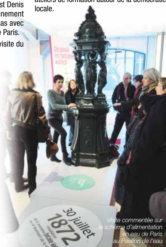
Visite commentée sur le schéma d'alimentation en eau de Paris au Pavillon de l'eau

Proposition de la Ville de participer à des ateliers de formation autour de la démocratie locale.