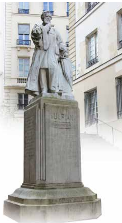
La statue d'Alfred Vulpian, rue Antoine Dubois et la statue de Georges Jacques Danton, place Henri Mondor