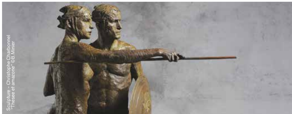
Sculpture - Christophe Charbonnel Thésée et amazone

Du mardi au samedi de 11h à 13h et de 14h30 à 19h