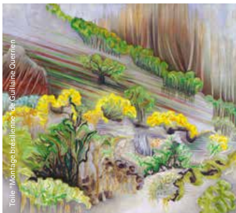
Toile "Montage brésilienne" de Guillaume Querrien