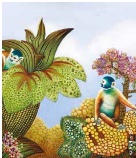
Peinture de Monique Gourgaud