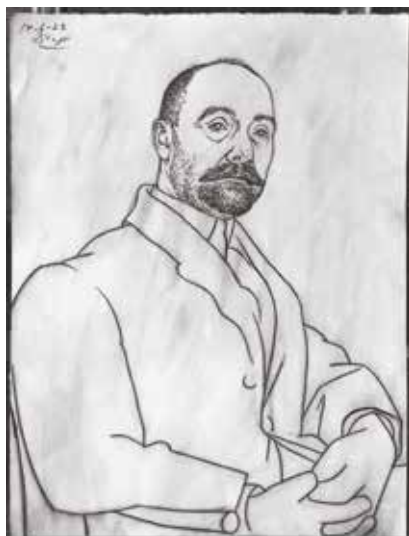
Portrait de Monsieur Élie Faure, 14 juin 1922, mine de plomb, s. d. h. g., 24 x 31 cm, collection particulière.

Du mardi au samedi de 15h à 19h et le matin sur rendez-vous