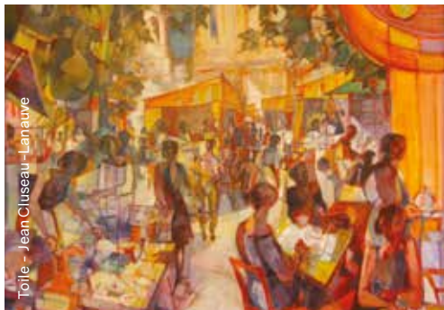
Toile - Jean Cluseau-Lanauve

Du mardi au samedi de 14h à 19h30 et sur rendez-vous au 06 61 86 61 14