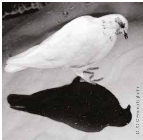
DUO © Emma Ughetti

Du mardi au vendredi de 13h à 19h Le samedi à partir de 11h