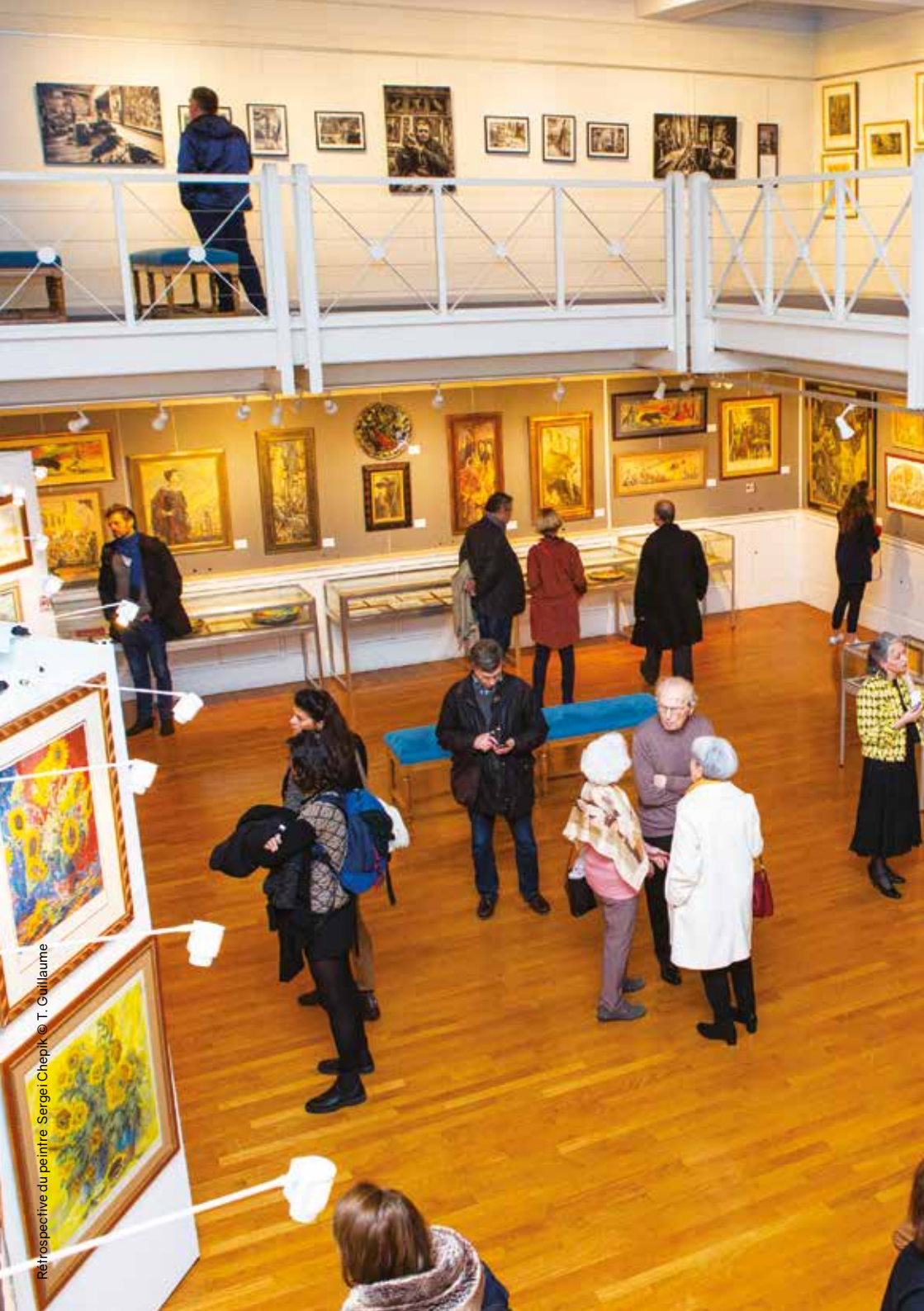
Rétrospective du peintre Sergéi Chepik