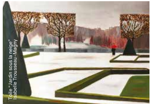
Toile "Jardin sous la neige" Isabelle Troussseau-Magny