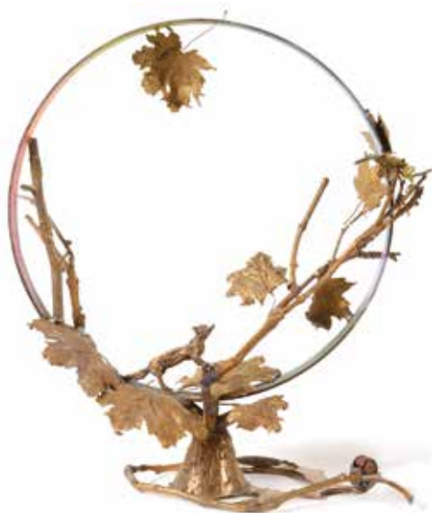
"Le Corbeau" - Sculpture de Florence de Pomthaud-Neyrat

Du lundi au samedi de 11h à 13h et 14h à 19h Fermeture le mercredi