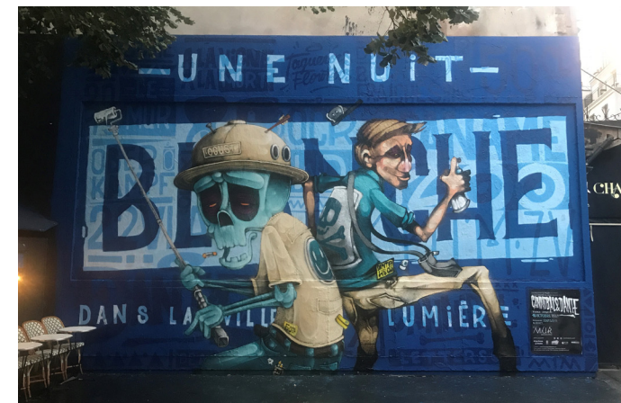
Image du mur en octobre 2019

Trois principes structurent l'action : le lieu, qui doit être unique, la rémunération des artistes pour leur œuvre et la sélection réservée aux seuls artistes urbains. D'autres initiatives proches de l'association Le M.U.R. existent maintenant en France et en Europe.