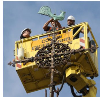
Démontage de la croix et du coq

Nos remerciements à M. Charvet (DECH) et M. Lodier (photos).