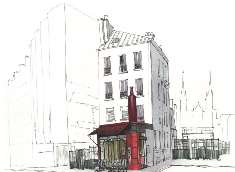
Dessin de Cendrine BONAMI-REDLER, extrait du livre « Dans son jus - Voyage sur les zincs » de Patrick BARD et Cendrine BONAMI-REDLER, Edition Elytis, août 2018.

Il se précipita sur son téléphone. Les premières réponses, quoique aimables, ne furent pas à la hauteur de ses attentes, à savoir : « C'est quoi cette Bouteille ? », « Vous n'êtes pas au bon numéro... », « La mairie n'est pas une succursale des objets trouvés »,