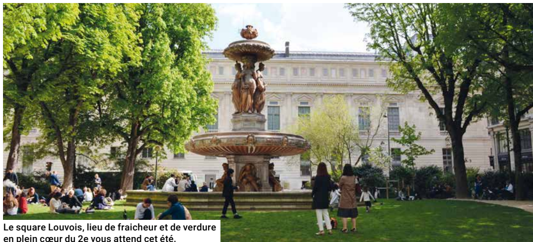
Le square Louvois, lieu de fraîcheur et de verdure en plein cœur du 2e vous attend cet été.

... Dans la très minérale rue Saint-Denis, les arceaux à vélo sont encadrés par des jardinières fleuries mises en place grâce au budget participatif. D'autres jardinières mobiles ont été installées là où la plantation d'arbres en pleine terre était techniquement impossible en raison des réseaux situés dans le sous-sol. Notons au passage que tous les travaux de voirie ou de requalification de l'espace public comportent désormais la