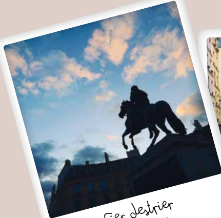
Fier destrier @mfcaulliez

N'hésitez pas à nous adresser vos clichés par courriel à mairie02@paris.fr ou sur Instagram avec #Paris02. Et n'oubliez pas de suivre @Mairiedu2!