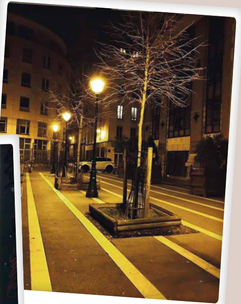
Dans la nuit