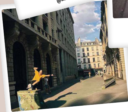
skate art @respirerparis