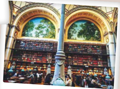
Heures Studioises @lamisanthrope