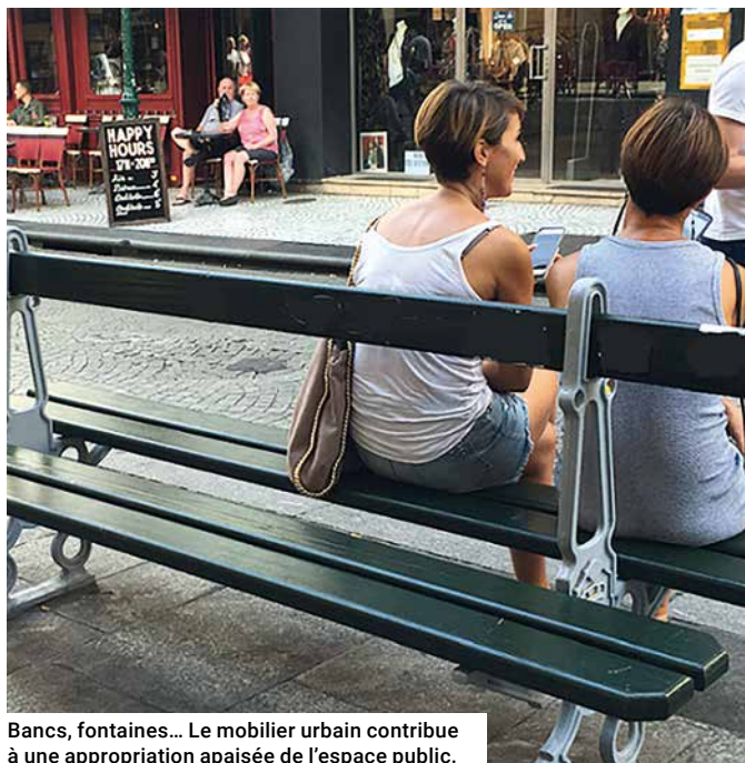
Bancs, fontaines... Le mobilier urbain contribue à une appropriation apaisée de l'espace public.

Deux marches exploratoires ont été menées dans le quartier Montorgueil - Saint-Denis en vue d'apporter des solutions aux diverses nuisances constatées par les riverains.