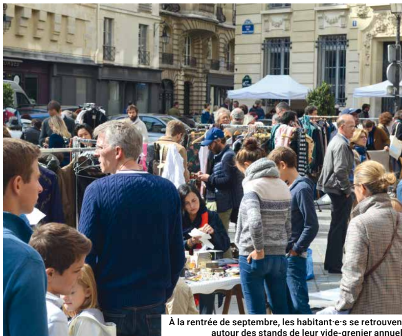
À la rentrée de septembre, les habitant·e·s se retrouvent autour des stands de leur vide-grenier annuel.

du 3 au 31 juillet, romans, polars, albums jeunesse, contes, mangas, BD ou encore pop-up vers le square Bidault. Autant d'ouvrages à lire (gratuitement) à l'ombre d'un arbre.