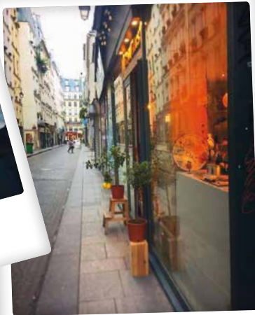
Le citronnier @catherinebcu