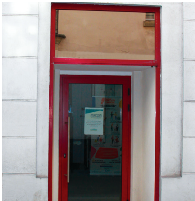
Maison des Aînés et des Aidants

Une plateforme de répit pour les Aidants, située au 1 rue Princesse viendra compléter l'Accueil de Jour Saint-Germain créé il y a une dizaine d'années et implantée au 17, rue du Four (les locaux des deux structures sont adjacents et gérés par la même association).