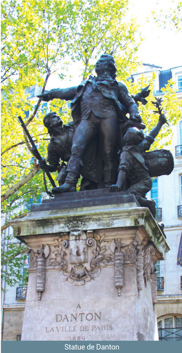
Statue de Danton

• La statue de Danton située sur le terre-plein central de la place Henri-Mondor (à la sortie du métro Odéon) vient d'être dotée d'un système d'éclairage. La statue se trouve à l'endroit précis de la maison qu'occupait Danton pendant la période révolutionnaire dont le quartier de l'Odéon fut le témoin privilégié (la maison de Danton a disparu lors du percement du Boulevard Saint-Germain).