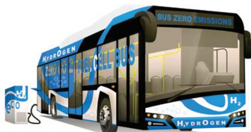
Nouvelle ligne de bus hybrides