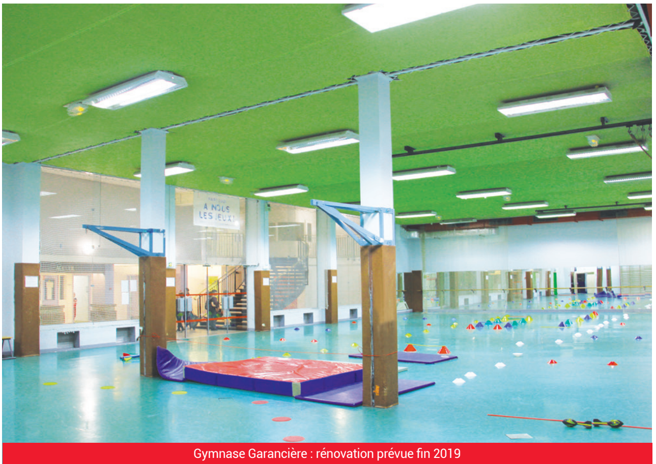
Gymnase Garancière : rénovation prévue fin 2019

En outre, un cheminement piétonnier entre les rues de Vaugirard et du Cherche-Midi sera créé en lisière du jardin protégé.