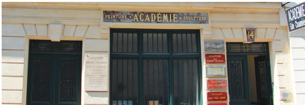
Atelier de la Grande Chaumière