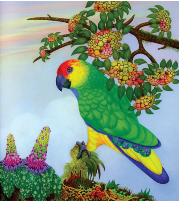
Exposition de Monique Gourgaud - Mars 2019