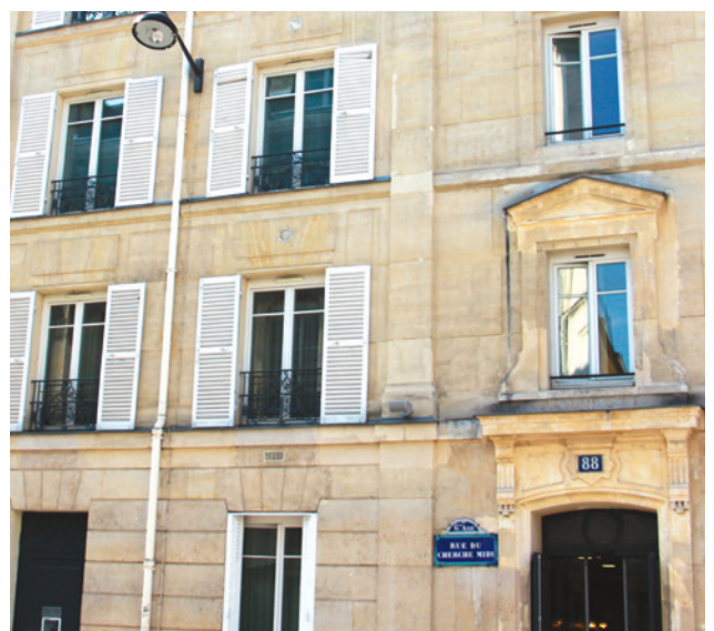
EHPAD - Les Pères Lazaristes

• L'ouverture d'autres EHPAD : L'allongement de la durée de la vie pour tous les Français et notamment pour les Parisiens impose la création de dispositifs renforcés, qu'il s'agisse du maintien à domicile le plus longtemps possible ou de l'accueil dans un établissement de type EHPAD.