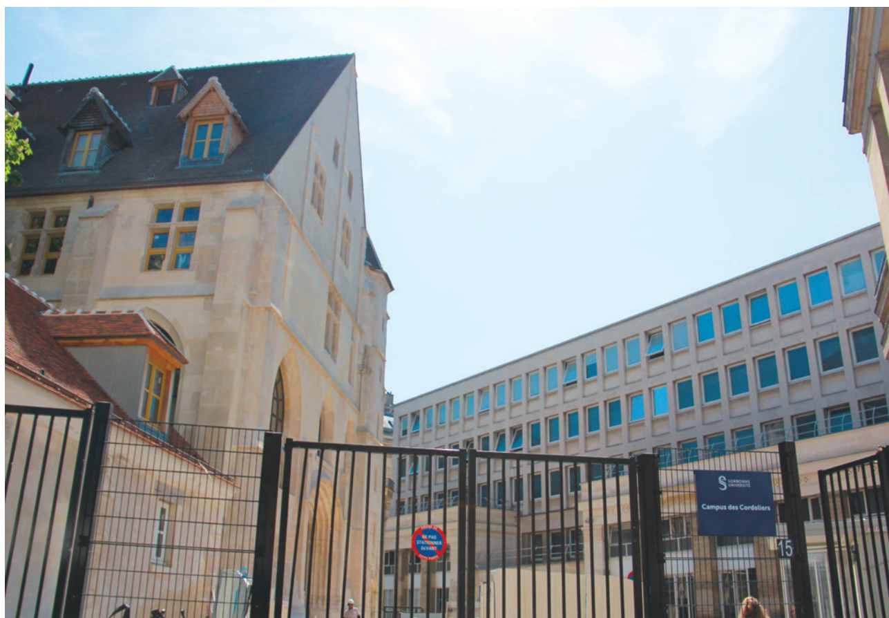
Couvent des Cordeliers