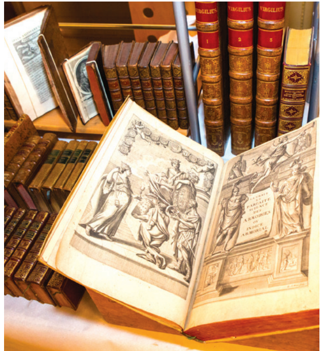
Salon des livres anciens - Janvier 2019