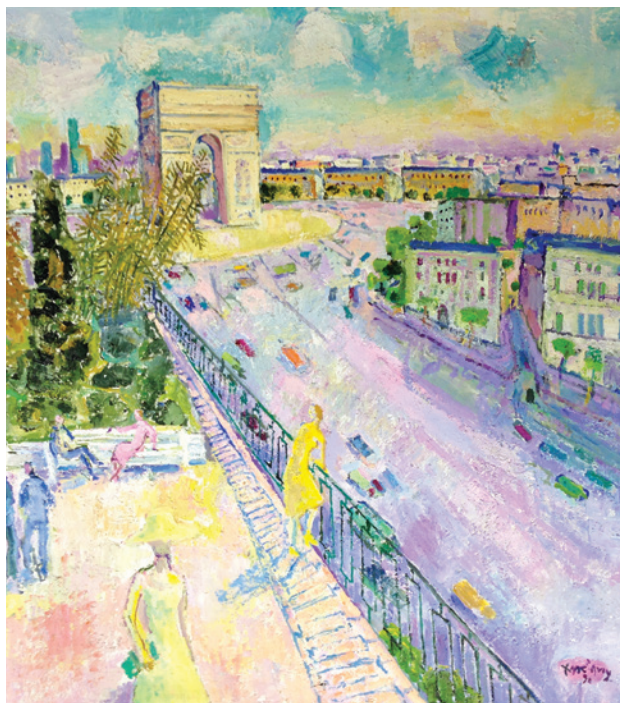
Mac-Avoy « Les Champs Elysées et l'Arc de Triomphe vus d'une terrasse » - Exposition en juin 2018

• Les Ateliers dits de la Grande Chaumière situés dans la rue éponyme, à proximité de la place Pablo Picasso (croisement des boulevards Raspail et Montparnasse) constituent un des derniers lieux mythiques de Montparnasse des années 1910 à 1930 (Ce que l'on appelle l'âge d'or). Fréquenté par les plus grands peintres de cette époque, les Ateliers de la Grande Chaumière n'ont pratiquement pas changé : dans des ateliers mythiques se côtoient peintres, élèves et modèles unis dans leur passion du dessin et de la peinture. En cours de classement et d'inscription à l'ISMH, les Ateliers de la Grande Chaumière doivent conserver leur écosystème unique !