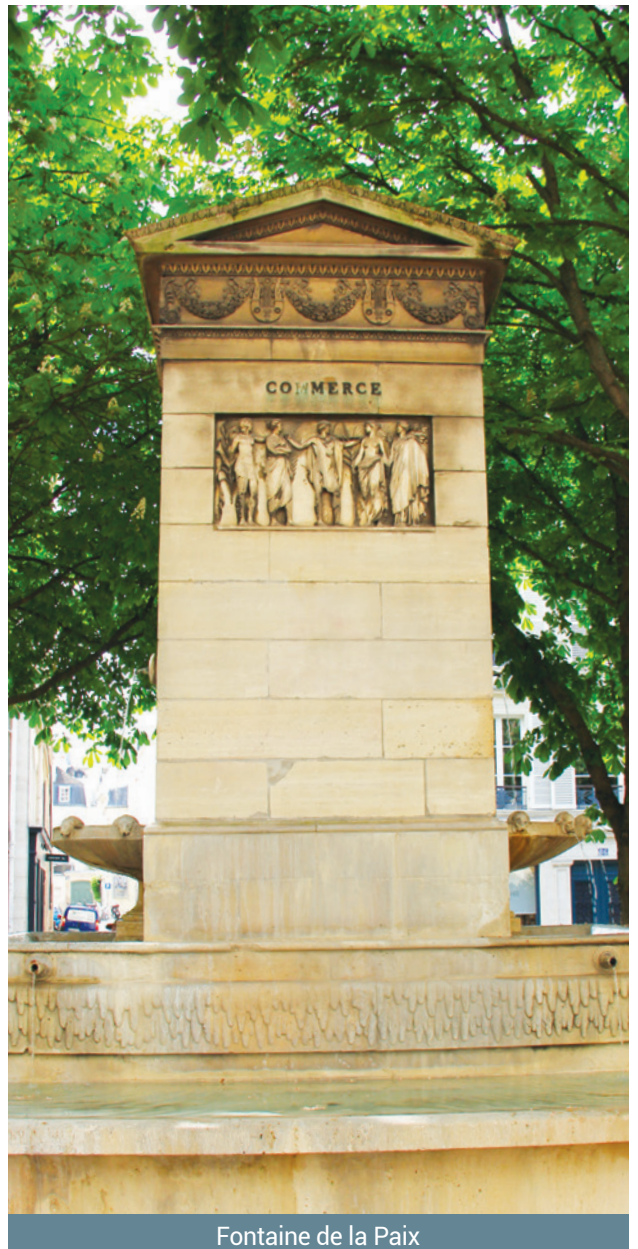
Fontaine de la Paix

• La fontaine de la Paix implantée aujourd'hui sur l'allée du Séminaire va être rénovée, remise en eau et illuminée. Ce projet, porté par le Conseil de Quartier Odéon, impliquera l'abattage des quatre arbres – en mauvais état – qui entouraient la fontaine et soulevaient son socle. D'abord installée sur l'arrière du Marché Saint-Germain, la Fontaine de la Paix a été implantée en 1935 sur son site actuel.