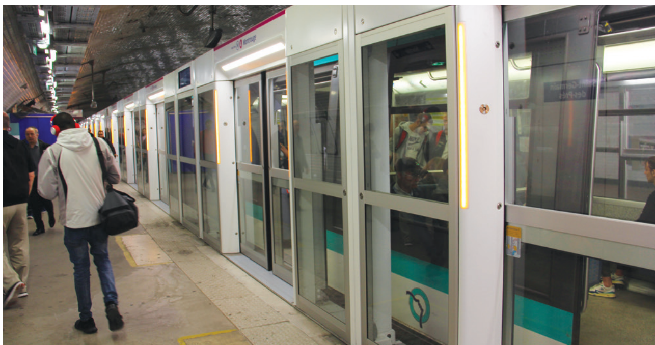
Métro ligne 4 - Station Saint-Germain-des-Près

Réalisées ou en projet, plusieurs actions dans le domaine des transports vont dans le sens d'une mobilité plus douce et plus fonctionnelle