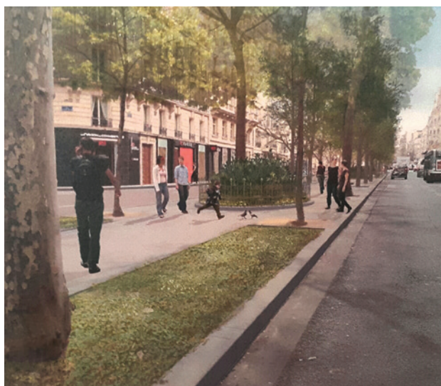
Terre plein central - Boulevard Raspail