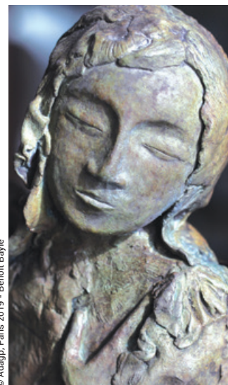
© Adagop, Paris 2019 - Benoît Bayle