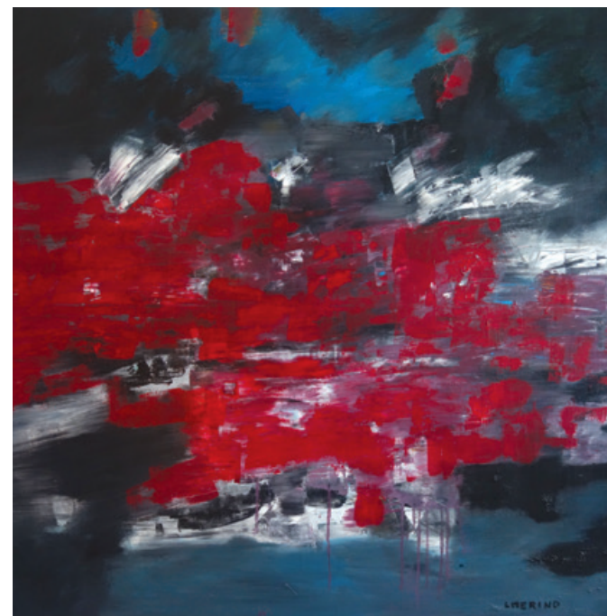
Huile sur toile de Louis MERINO - "Flamboyant"

Il a souvent exposé au Théâtre de la Criée à Marseille où il a joué, à Paris et dans l'Aveyron. En 2019, c'est au Musée d'art contemporain de Saint-Petersbourg et au Centre européen de Conques que plusieurs de ses toiles ont été présentées.