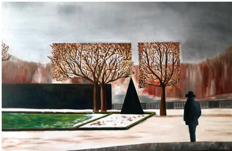
Toile Isabelle Trouseau