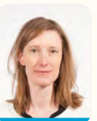
Maud GATEL Conseillère de Paris déléguée auprès du Maire du 15 e aux services publics de proximité