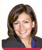
Anne HIDALGO Maire de Paris