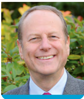
Philippe GOUJON Maire du 15 e – Député de Paris (12 e circonscription) Conseiller de Paris