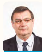
Jean-François LAMOUR Conseiller de Paris Député de Paris