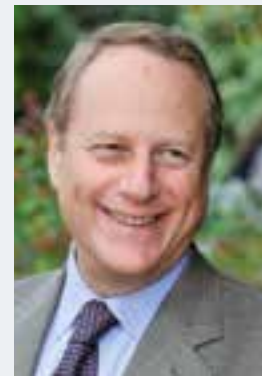
Philippe GOUJON Maire du 15 e - Député de Paris

Dans un arrondissement de plus en plus peuplé (240.000 habitants, soit 10.000 de plus en quelques années), le soutien de la Mairie du 15 e aux familles concerne tout autant les jeunes ménages que les seniors, les tout-petits que les étudiants. La nouvelle maternité Sainte-Félicité ouvrira dans quelques mois. Quatre micro-crèches ont été créées depuis 2014, la crèche des Morillons a été rénovée, Modigliani le sera en 2017, et quatre crèches seront prochainement livrées. Une halte-garderie ouvrira à la rentrée 2016 rue de Lourmel. Deux écoles publiques (rues Dombasle et de la Saïda) et une école privée (Saint-Jean-Paul II) ont ouvert, alors que les travaux de rénovation du groupe scolaire Dupleix-Cardinal Amette commencent bientôt, puis, je m'y emploie, ceux du groupe scolaire Brancion . 2014 a vu l' ouverture de l'annexe du collège Citroën avant de gros travaux de la cité scolaire Buffon et la rénovation du lycée Louis Armand , qui démarrera l'année prochaine.