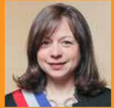
Catherine BARATTI-ELBAZ Maire du 12 e arrondissement