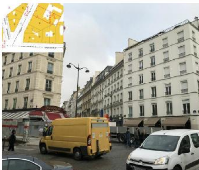
Les antennes ne sont pas visibles