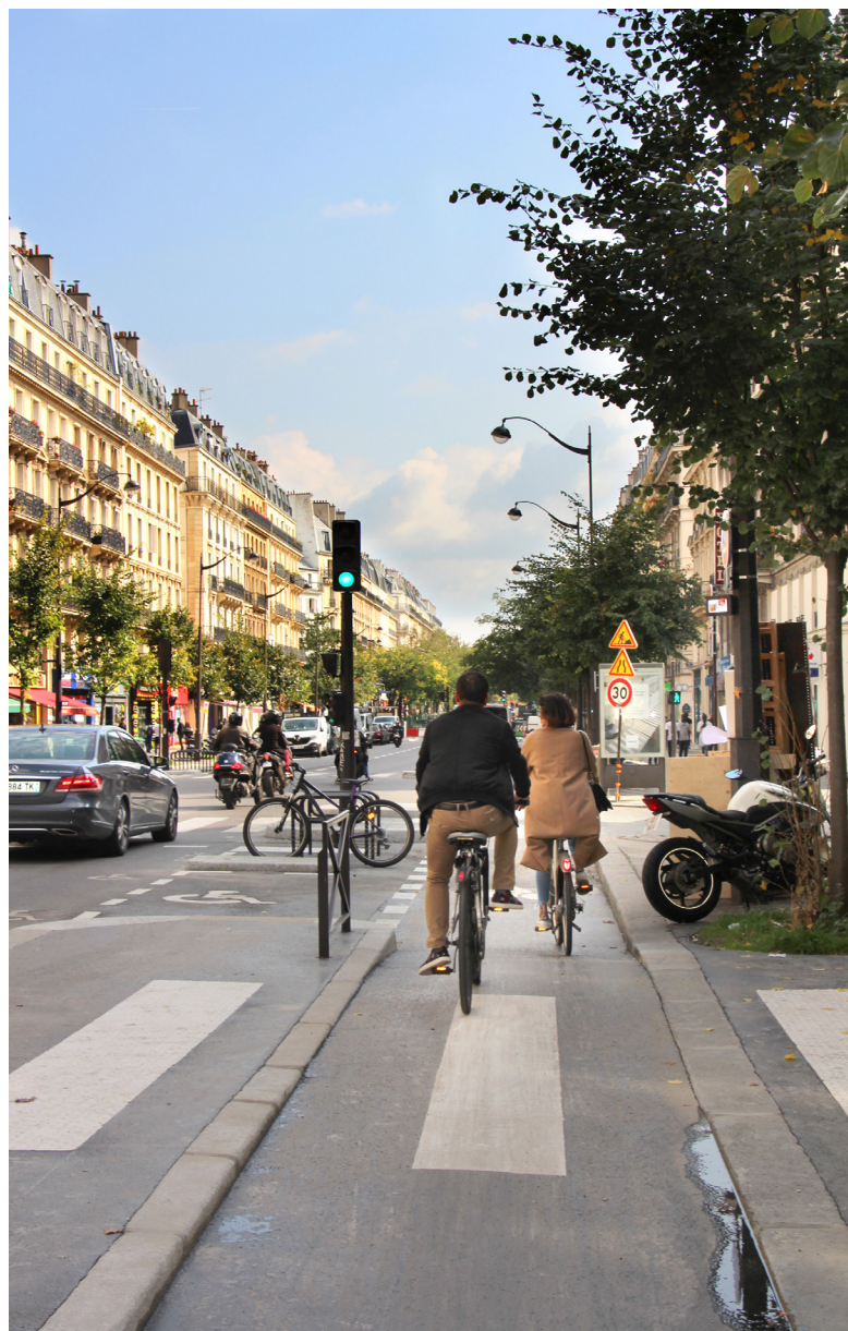
PHOTO DU TRONÇON LIVRÉ

🚧 La largeur piétonne des trottoirs reste inchangée.