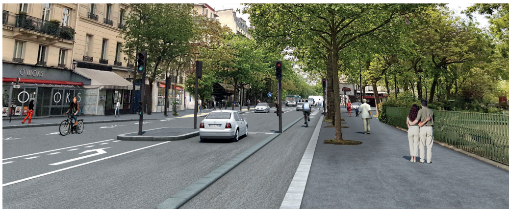
PHOTOMONTAGE DU PROJET

Toutes ces informations sont également consultables sur paris.fr .