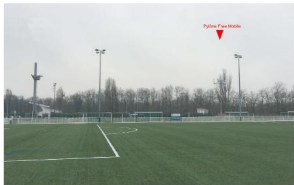
Etat de l'existant :