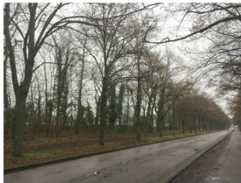
Etat de l'existant :