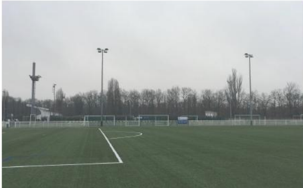
Etat de l'existant :