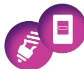
AMPOULES FLUOCOMPACTES / COMPTEUR LINKY 87 V/m