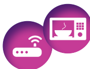
WI-FI/ FOUR MICRO-ONDES 61 V/m