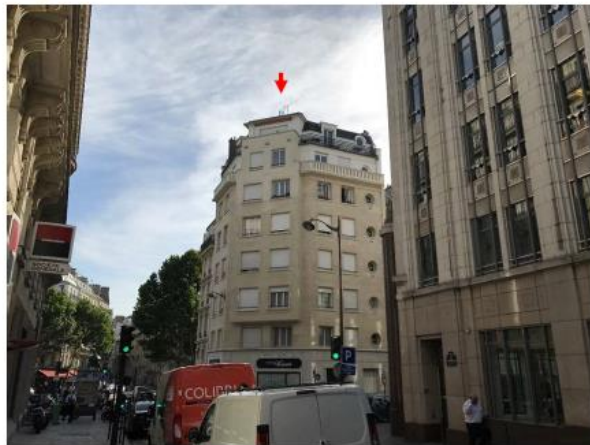
Etat du projet :