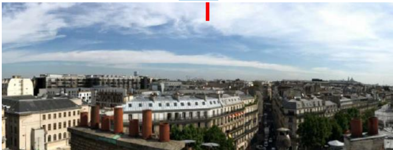
Azimuth 140° :