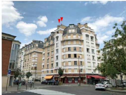
Etat de l'existant : Etat du projet :