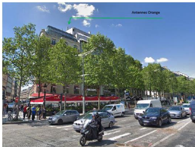
Aucun impact visuel