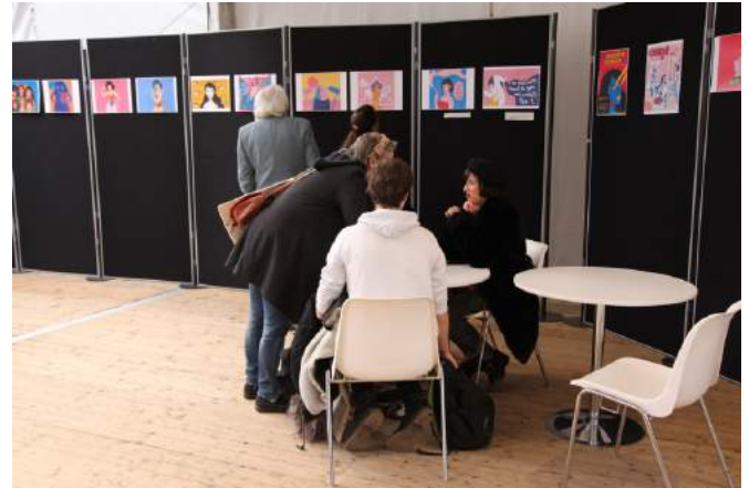
Rencontre du public avec l'artiste