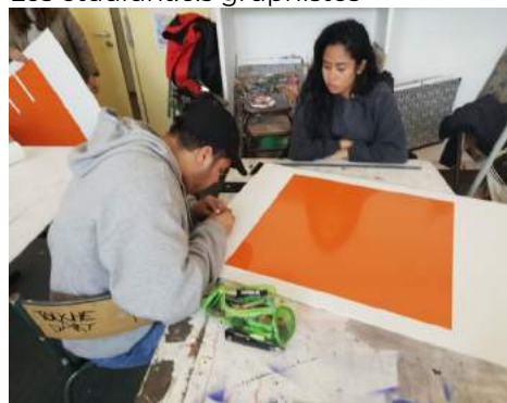
Les étudiant.e.s graphistes

Une trentaine d'étudiant.e.s en 1 ère année de DNMADE graphisme, au Lycée de Sèvres, encadrés par 3 enseignants réfléchissent écrivent, dansent et réalisent les panneaux 4 faces servant de base à la performance présentée le 24 mars « Uterriens – Uterriennes de tous les pays, Unissez-vous » !