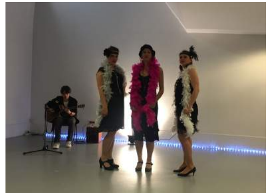
Les Triplettes de Belleville