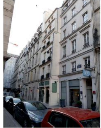
Le site n'est pas visible depuis ce point de vue