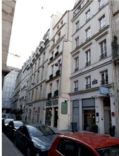
Etat de l'existant :