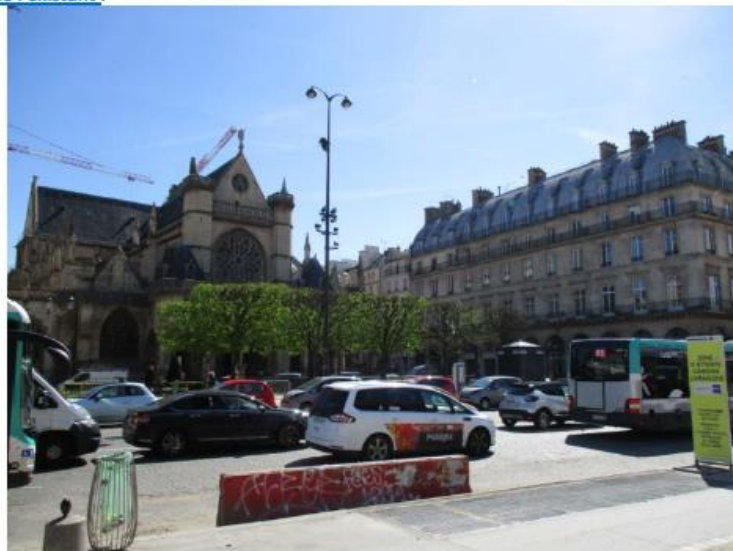
Etat du projet :