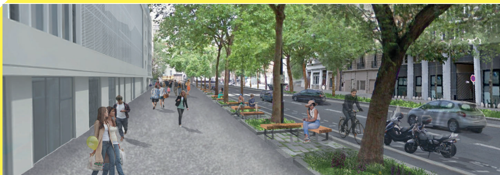
Principe d'aménagement de l'avenue de Saint-Mandé, à hauteur de la nouvelle université Paris III.

Les travaux d'aménagement de l'avenue de Saint-Mandé débutent mi-juillet. Au terme des travaux, cette partie de l'avenue sera transformée : apaisée et davantage végétalisée, elle offrira de nouvelles assises devant la future université Paris III ainsi qu'un aménagement cyclable. Ses vastes espaces piétons lui permettront d'accueillir au mieux les nouveaux étudiants. Le carrefour de l'avenue de Saint-Mandé avec les rues de Picpus et Fabre d'Églantine sera également réaménagé pour le rendre plus fonctionnel et plus sécurisé pour les piétons.