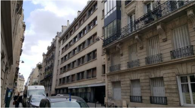
Etat de l'existant :