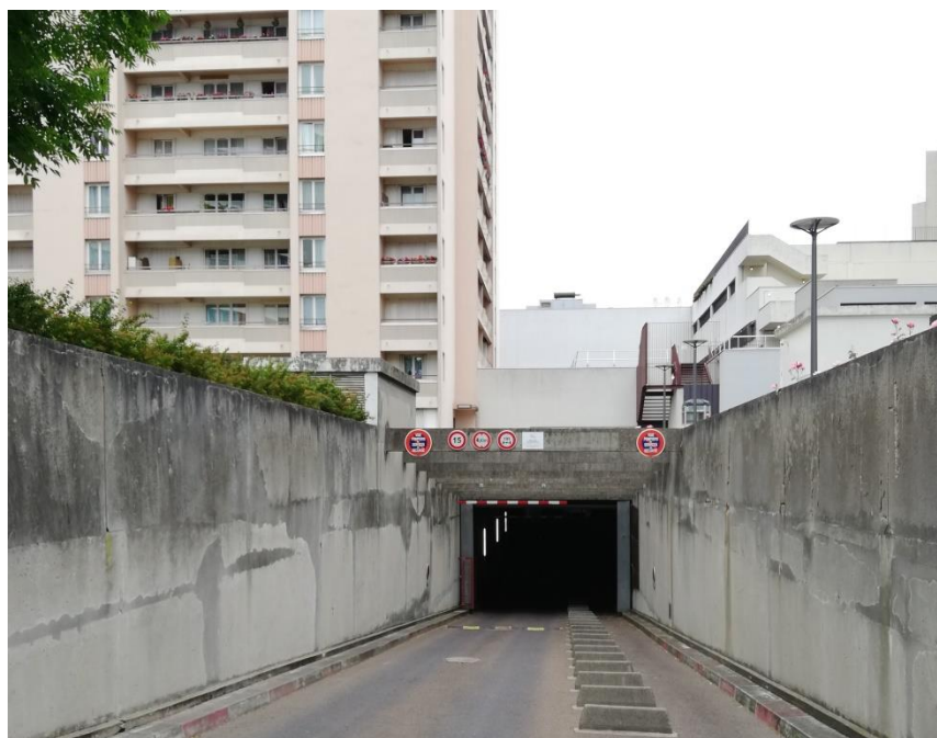
Accès au sous-sol au gabarit 19t

Adresse : L'accès camion se fait au niveau du 31 rue Voltaire à Malakoff. Surfaces : 2 plateaux superposés de 60 m 2 environ chacun.