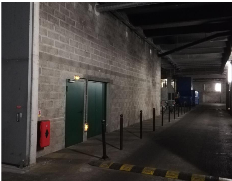
Local 3 en sous-sol, accessible en camion 19 t / 4.1 m de hauteur