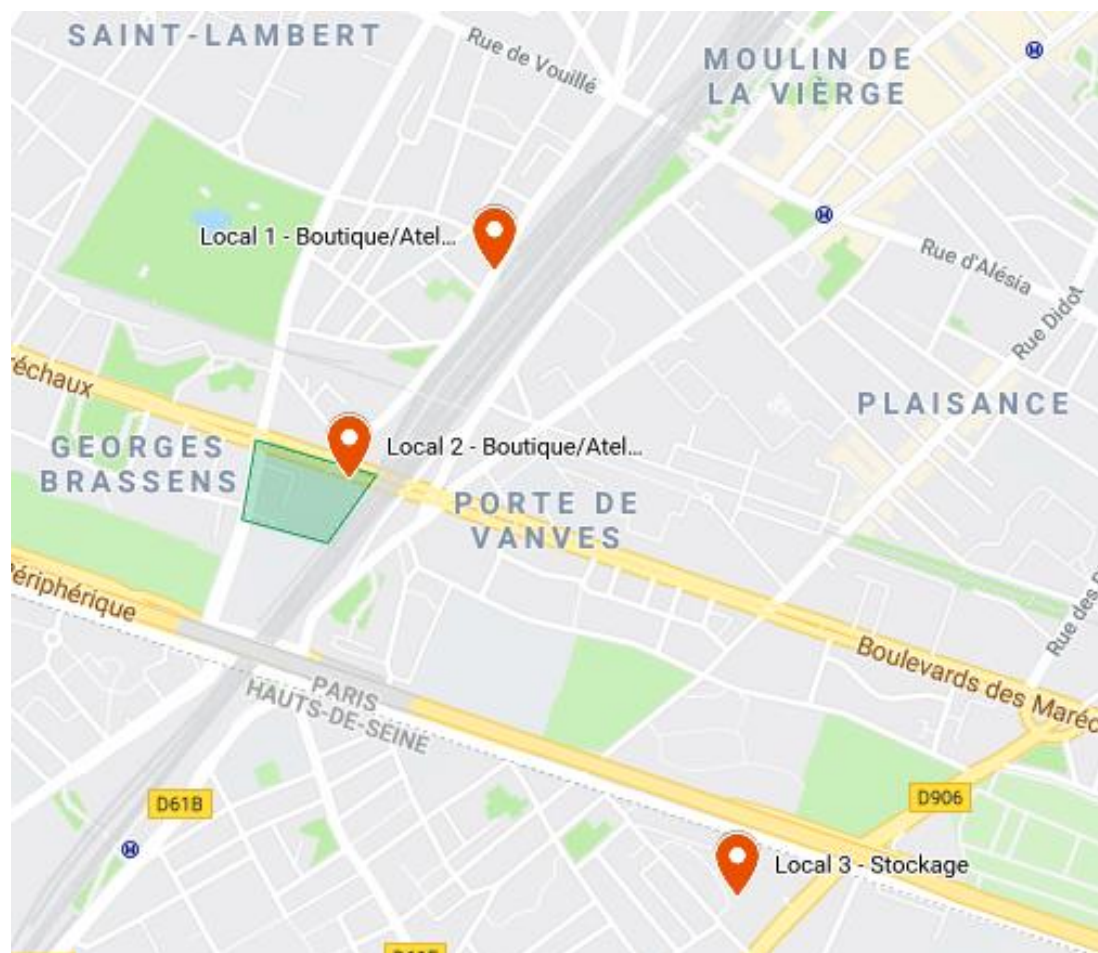
Localisation des 3 locaux pouvant accueillir la préfiguration de la Bricothèque-Ressourcerie (orange) et périmètre de l'opération de renouvellement urbain qui intégrera une bricothèque-ressourcerie (vert)