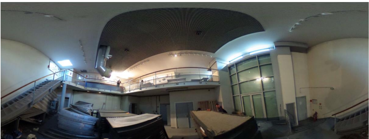
Vu à 360° du local 2

Adresse : Côté paire Boulevard Lefebvre (15 e ), face au 31 rue Jacques Baudry