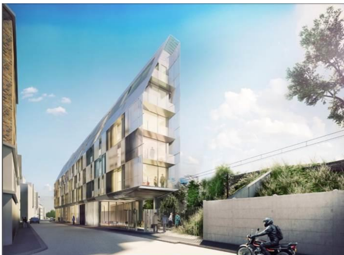
Rendu architectural du bâtiment à construire

Adresse : 77 rue Castagnary, 75015 Paris, le bâtiment reste à construire.