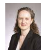
Colombe Brossel, adjointe à la Maire de Paris, chargée de la sécurité, de la prévention, des quartiers populaires et de l'intégration