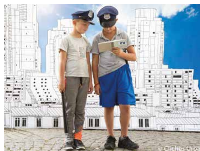
L'association Clichés Urbains propose depuis 2008 des ateliers et animations photographiques aux résidents du quartier.

Les élus et le commissariat de police du 19 e ont demandé au ministre de l'Intérieur de renforcer les effectifs de police dans le 19 e arrondissement. Le ministre s'est engagé à les remettre à niveau. Dès cet été, le Groupement parisien Inter-bailleurs de Surveillance (GPIS) mettra en place des rondes à partir de 18h. Ce service de prévention et de surveillance a pour missions essentielles de prévenir la délinquance, assurer une présence humaine sur le site.